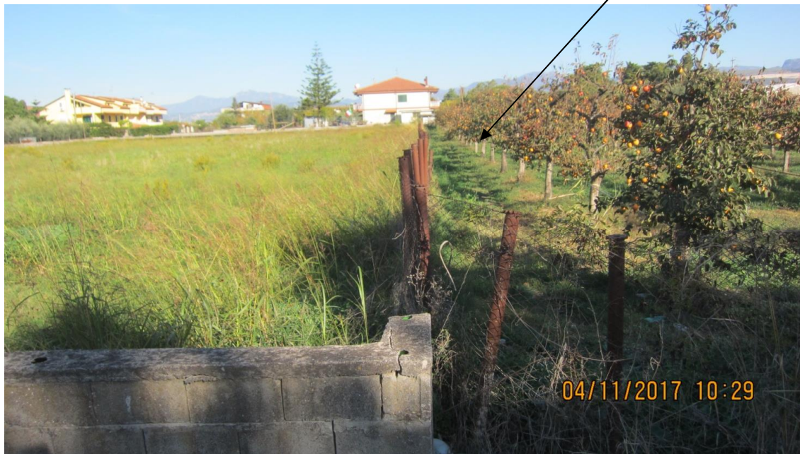
Foto 8- Vista degli edifici tipo esistenti a nord del fondo Barone , a confine con la particella 68