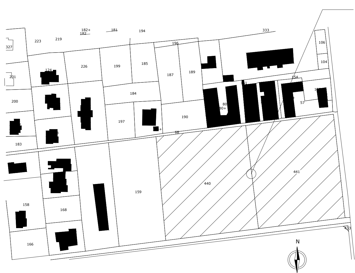
Stralcio di mappa Fg 39 Scala 1

Suolo oggetto di P.U.A. p.lla 440-441 fg. 39