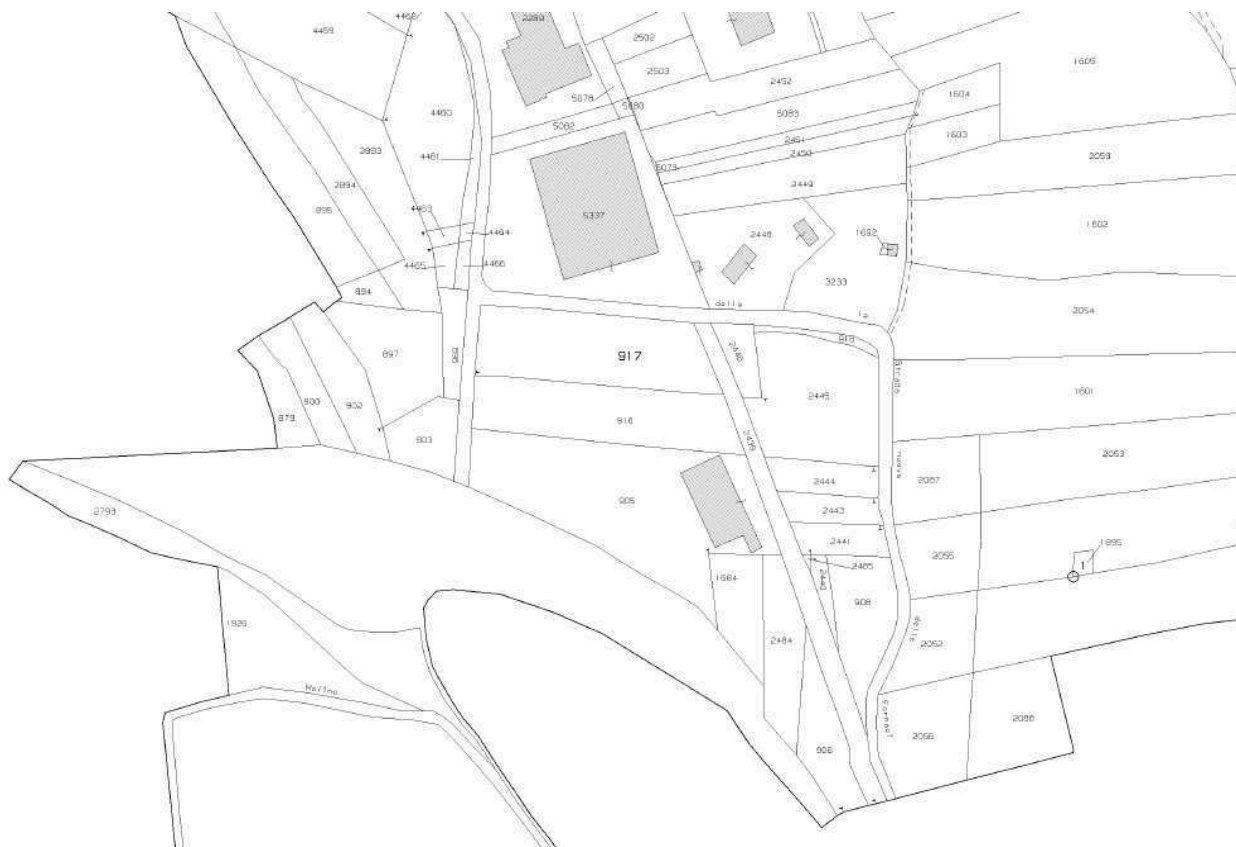
Catasto Terreni – Sezione di Voldomino

La suddetta area interessa i mappali identificati al Catasto Terreni della Sezione Censuaria di Voldomino - Comune di Luino, e precisamente: