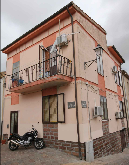
PARTICELLE DI PROPRIETA' Scala 1/5000