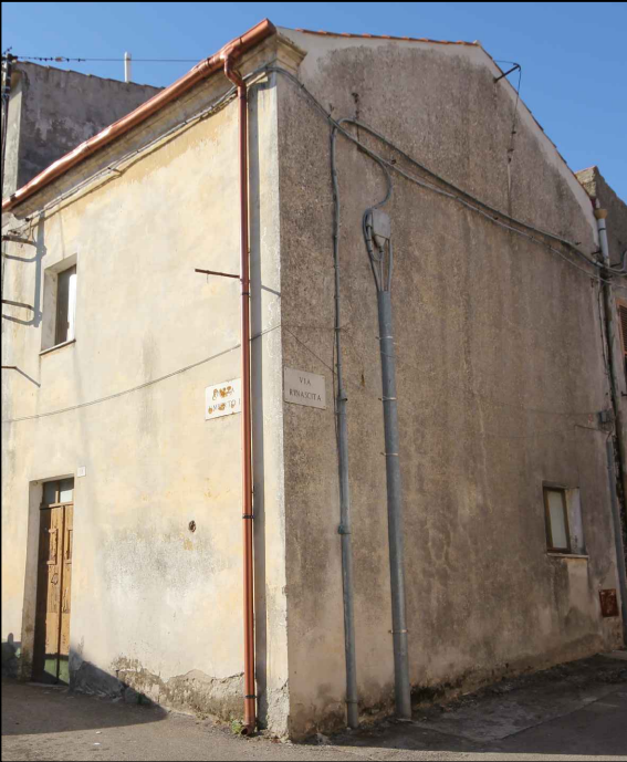
PARTICELLE DI PROPRIETA' Scala 1/5000