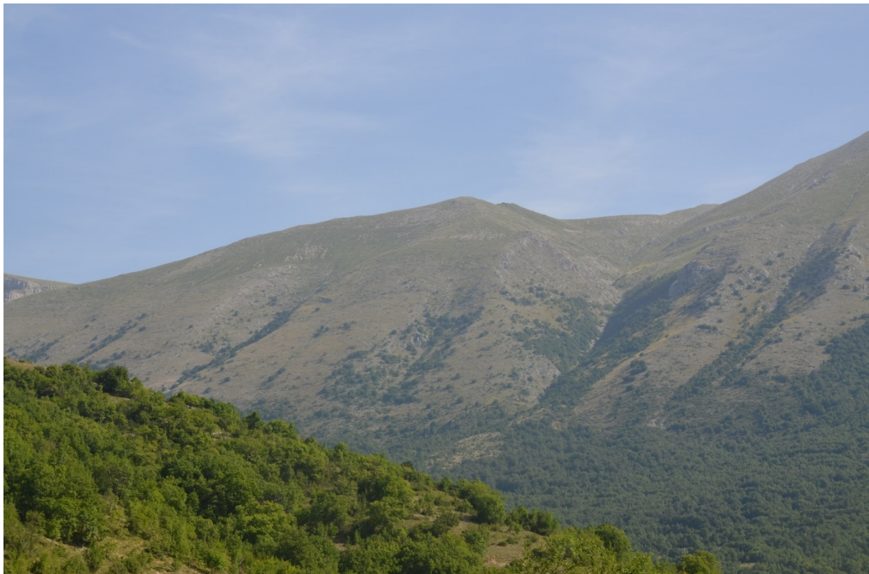
Figura 3. Panoramica sui siti ubicati sui pendii del Monte Rozza e sul versante est del Monte di Sevice (siti n°4-5-6-7-8-14) - Foto 2