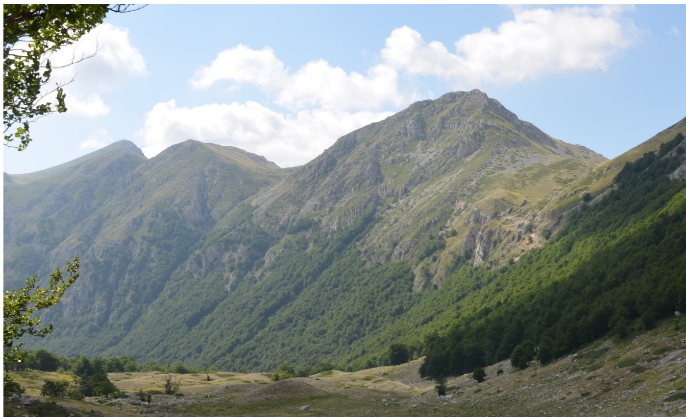
Figura 20. Panoramica sui siti di Monte del Vallone di Teve - Foto 21