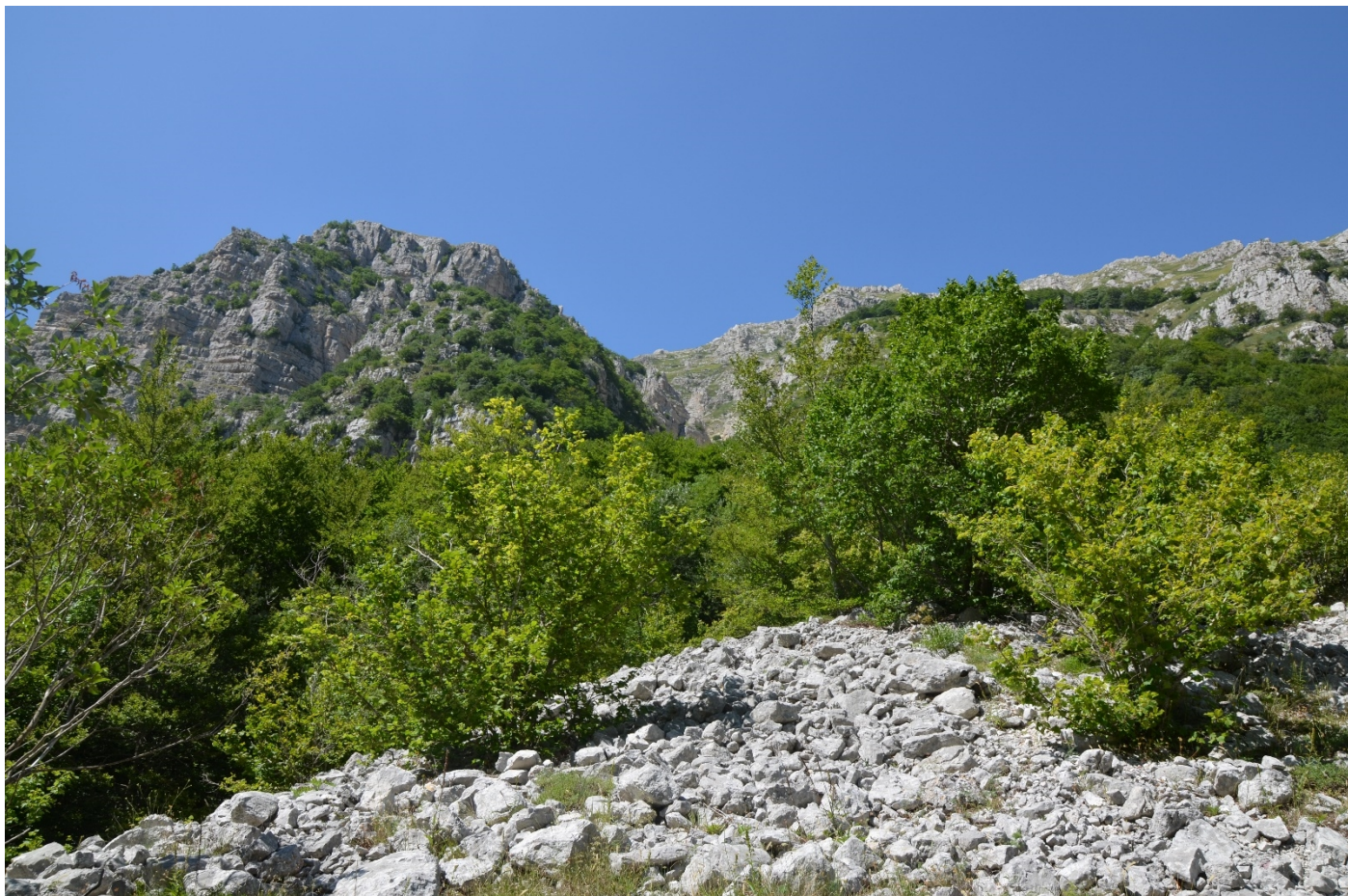
Figura 14. Vallone di Teve - da zona di arresto verso monte - Foto 13