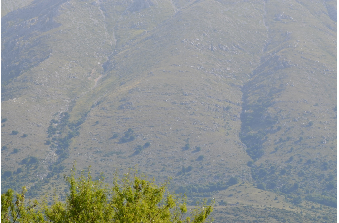
Figura 8. Vallone dell'Orso e vallone Sfonnato, dettaglio sulle zone di arresto - Foto 7