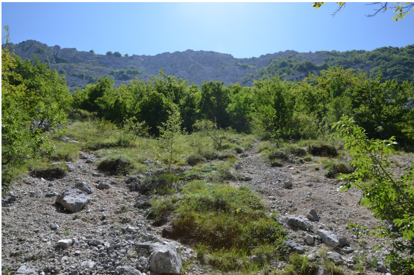
Figura 12. Vallone di Teve, da zona di arresto (sentiero) verso monte - Foto 11