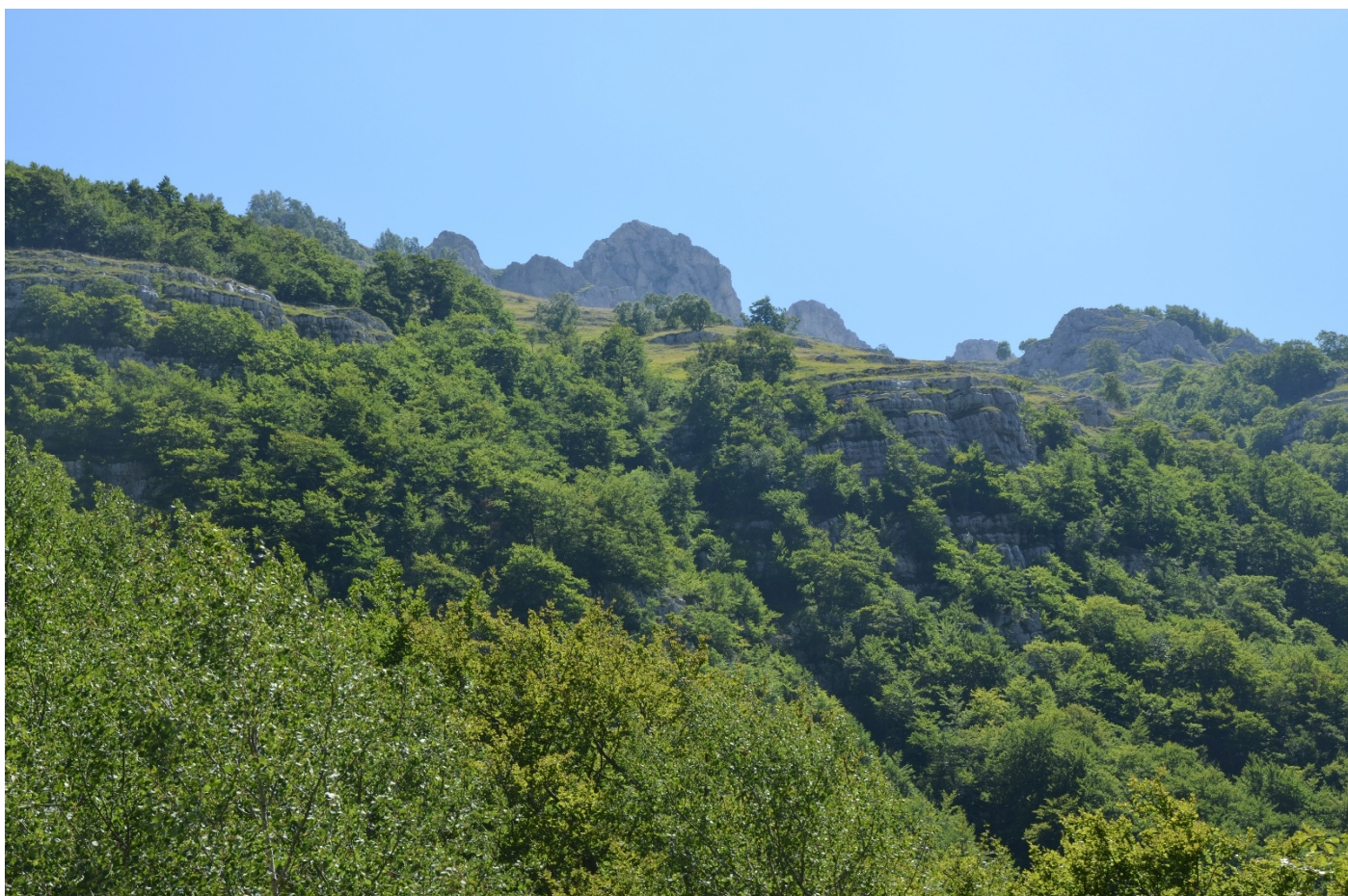
Figura 13. Vallone di Teve, dettaglio sulla zona di distacco e successivo scorrimento di uno dei siti - Foto 12