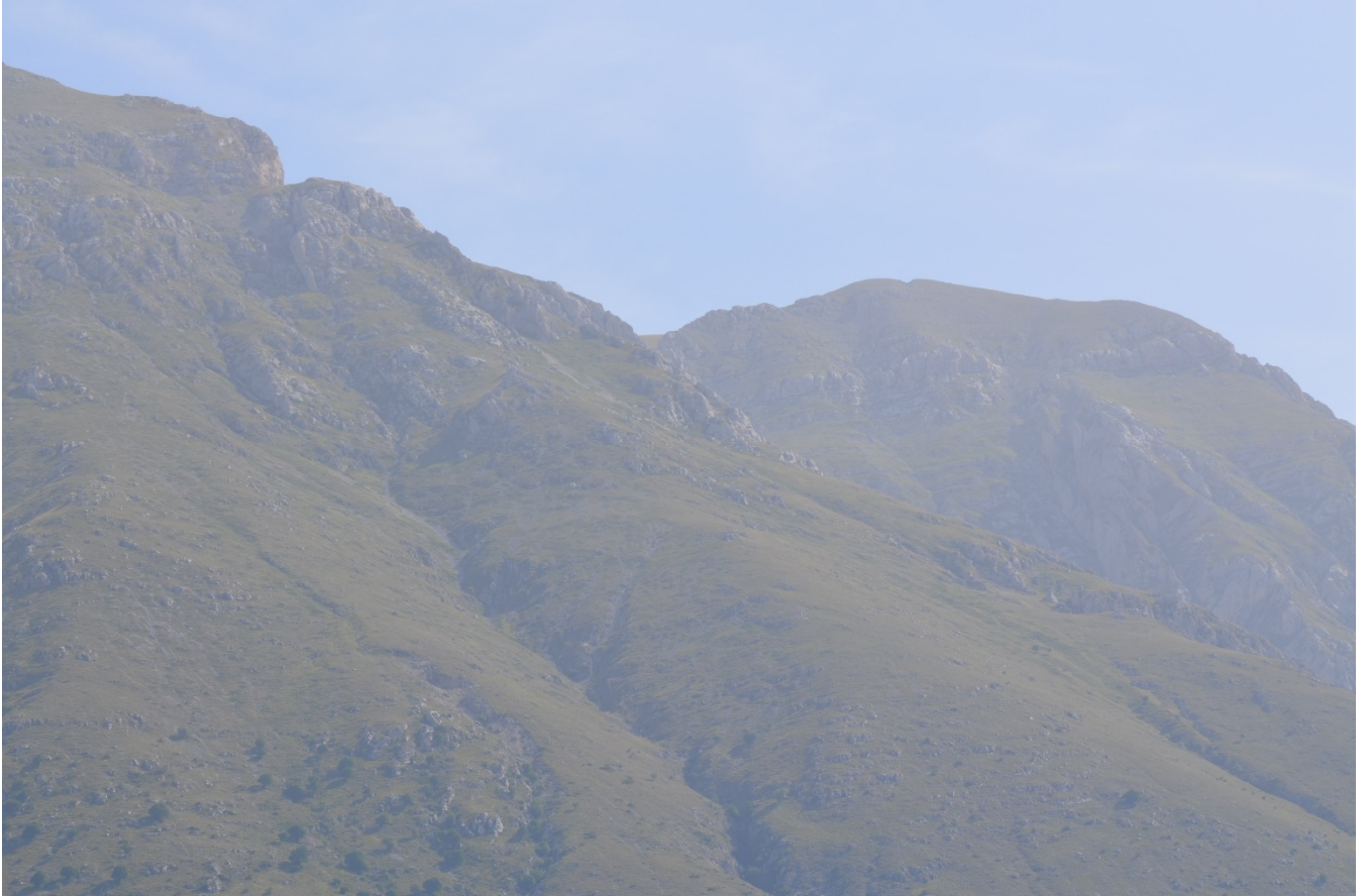
Figura 6. Rava della Croce, dettaglio sulla zona di distacco - Foto 5