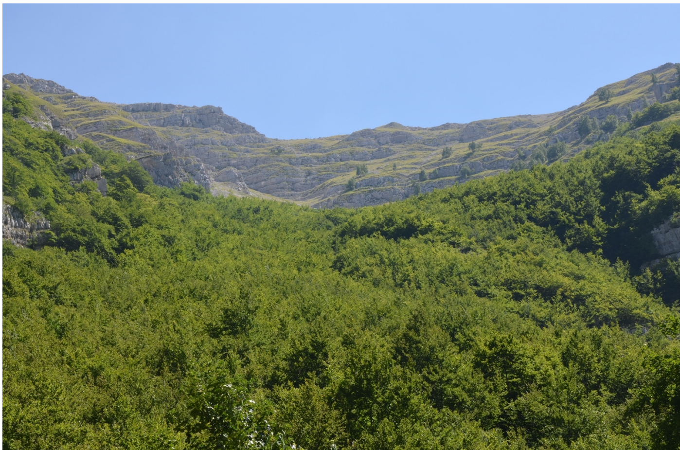
Figura 16. Vallone di Teve, dettaglio zona di distacco - Foto 15