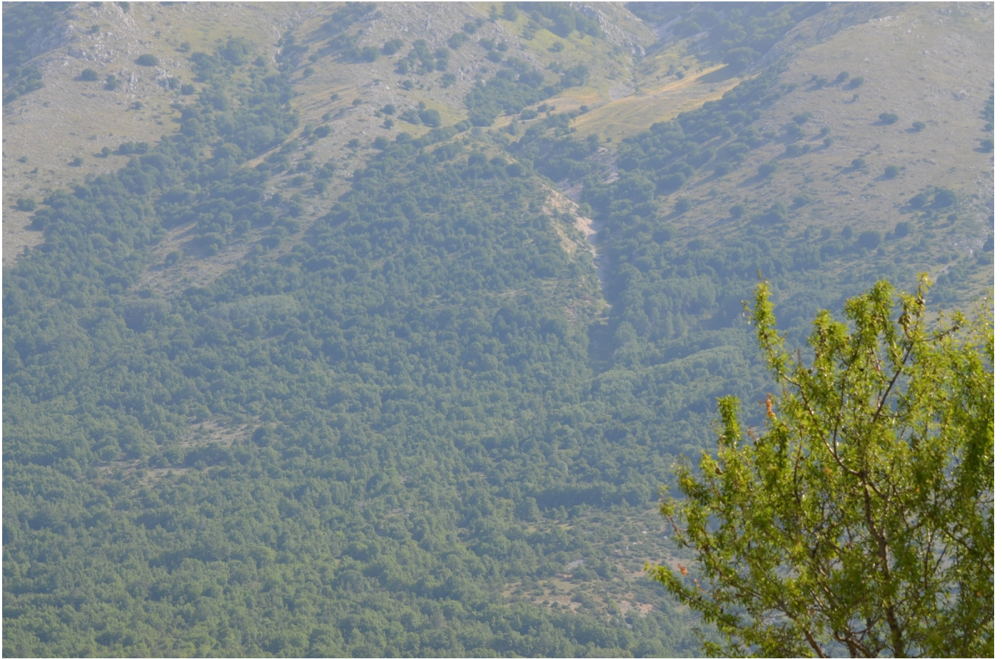
Figura 10. Vallone della Chiave, dettaglio della zona di scorrimento e arresto - Foto 9