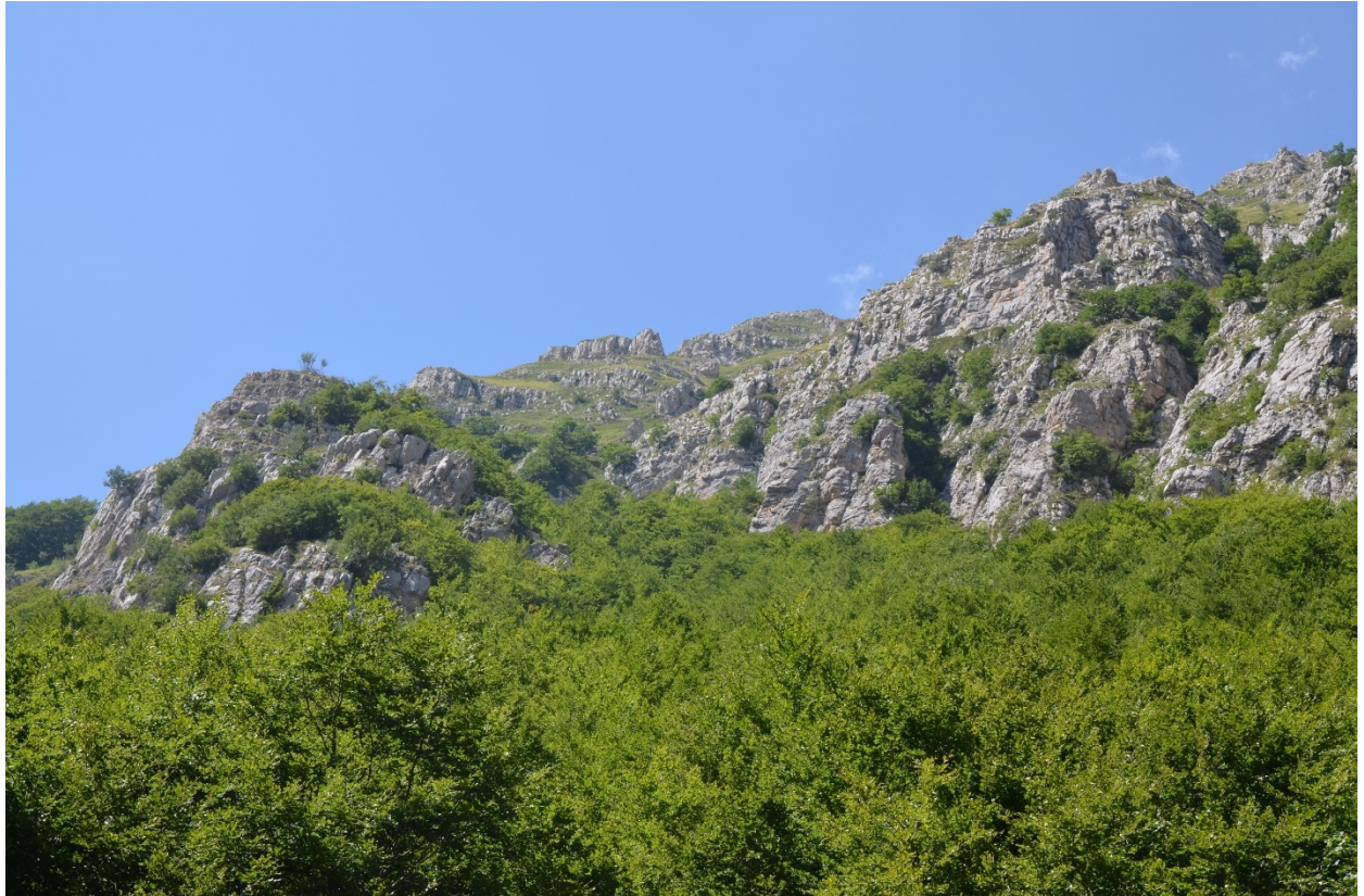
Figura 18. Vallone di Teve (sito n°12), dettaglio su zona di distacco e successivo scorrimento - Foto 17