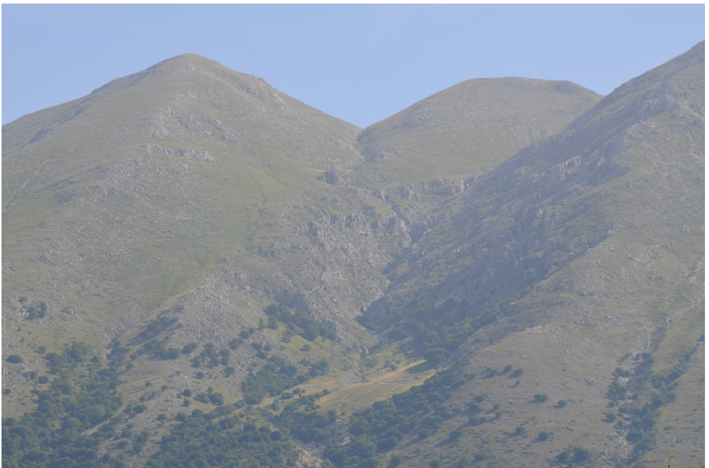
Figura 9. Vallone della Chiave, dettaglio - Foto 8