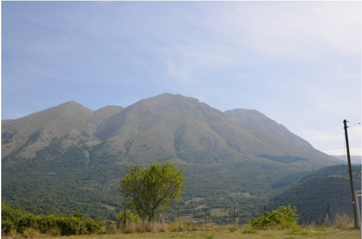
Figura 2. Panoramica sul Monte Velino e sul Monte di Sevice con i siti sulle loro pendici - Foto 1