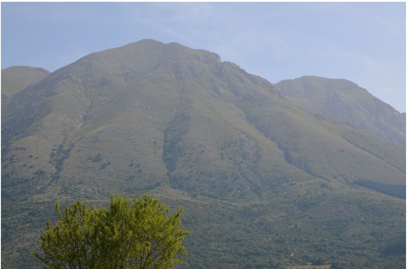
Figura 5. Vallone dell'orso, Vallone Sfoncato e Rava della Croce, panoramica sui 3 siti sul versante sud-ovest del Monte Velino - Foto 4