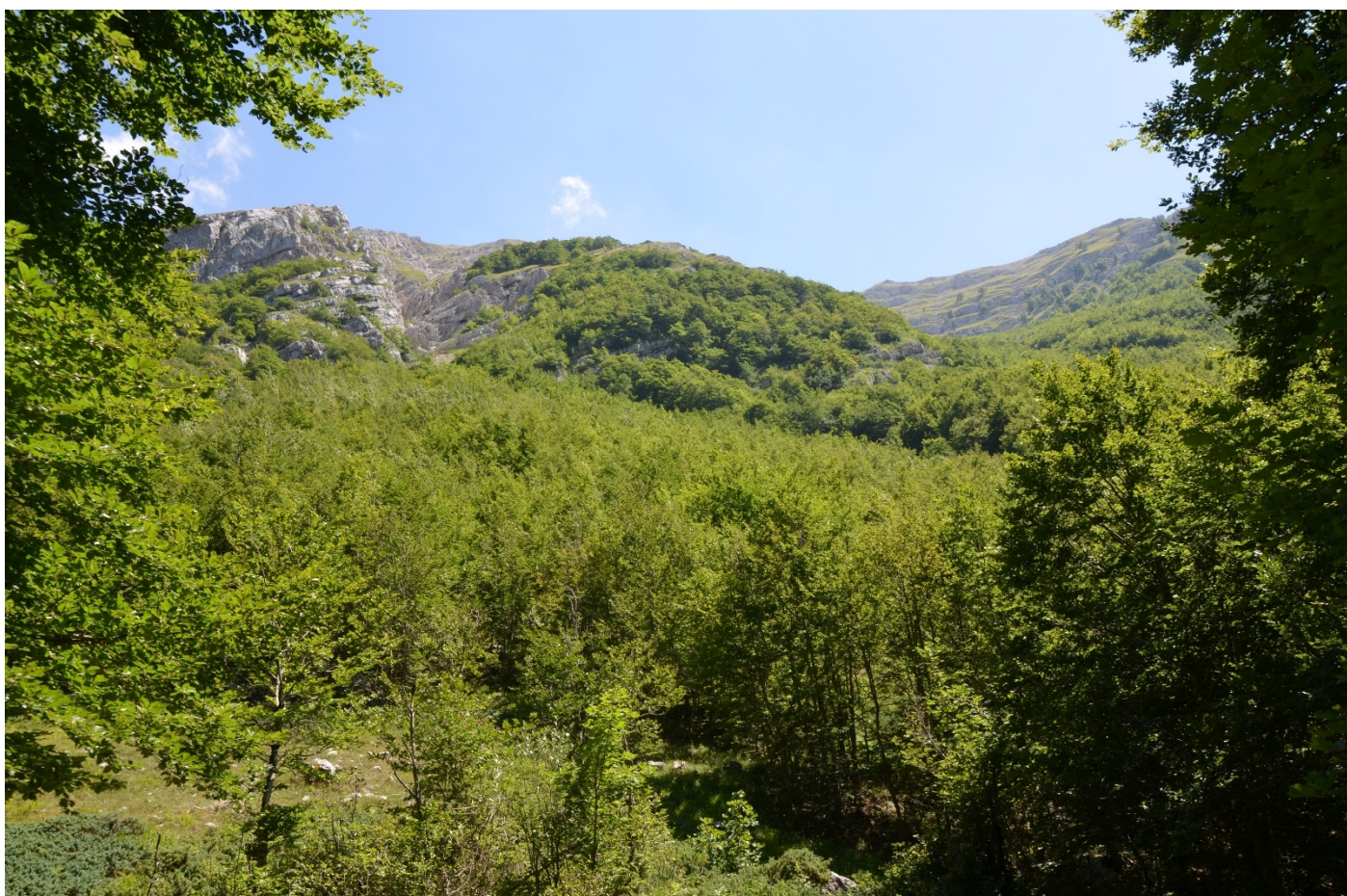
Figura 17. Vallone di Teve, da zona di arresto verso monte - Foto 16