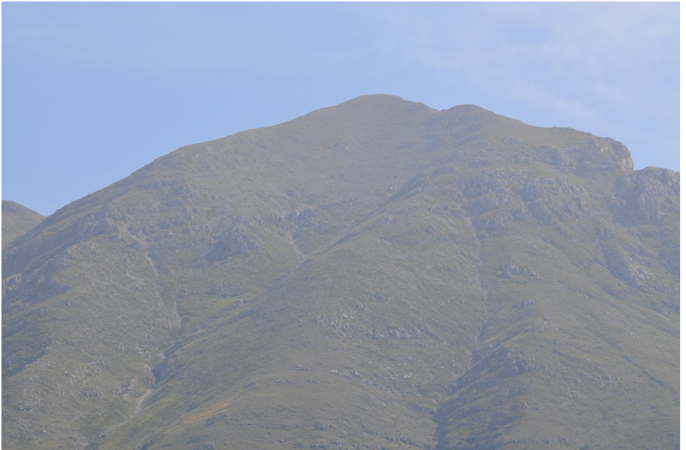
Figura 7. Vallone dell'Orso e Vallone Sfonnato, dettaglio sulle zone di distacco - Foto 6