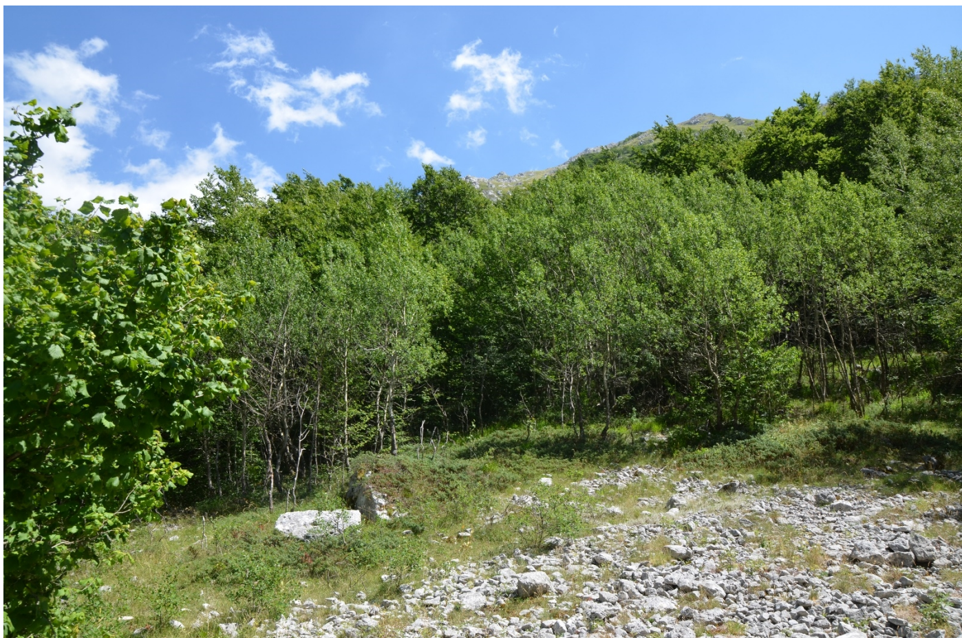
Figura 15. Vallone di Teve, vegetazione più giovane della circostante in zona di arresto - Foto 14