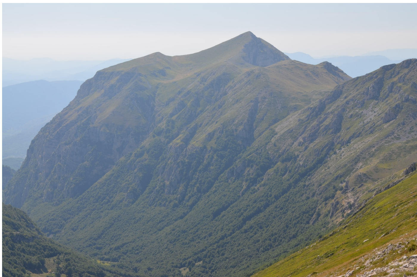
Figura 21. Panoramica sui siti in destra orografica al Vallone di Teve dal Colle dell'Orso – Foto 22