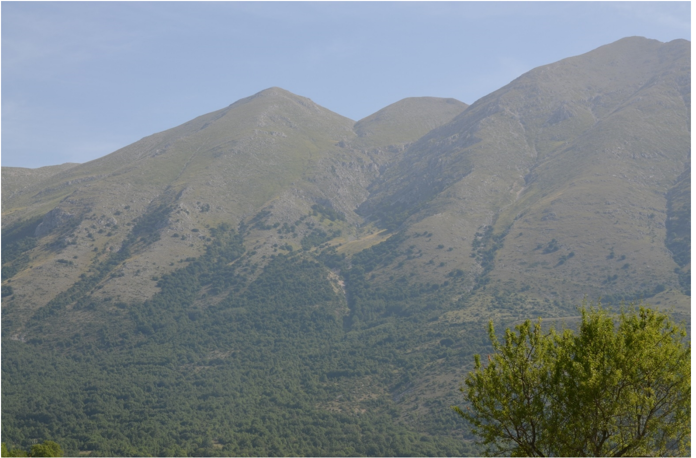
Figura 4. Vallone della Chiave, panoramica del sito al centro della foto - Foto 3