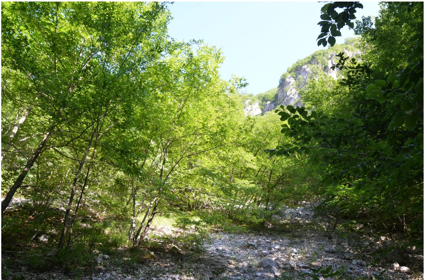
Figura 11. Vallone di Teve, foto verso monte - Foto 10