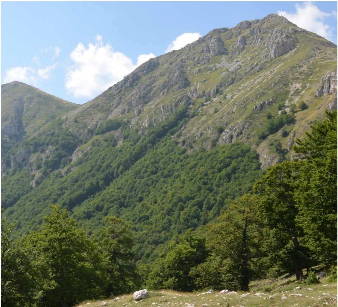
Figura 19. Panoramica del sito da monte nel Vallone di Teve - Foto 20