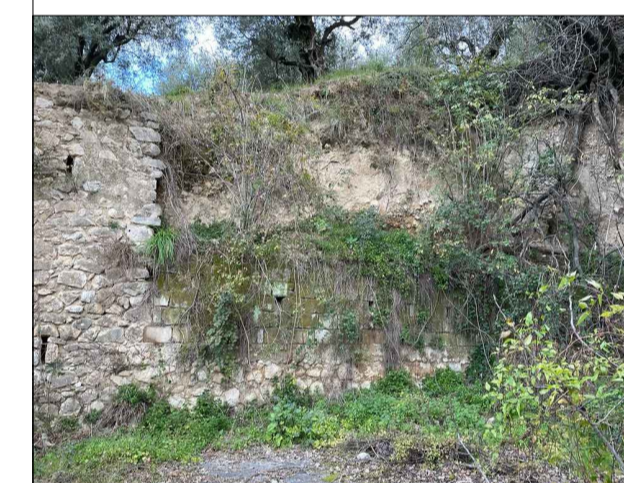
Parete frontale EST