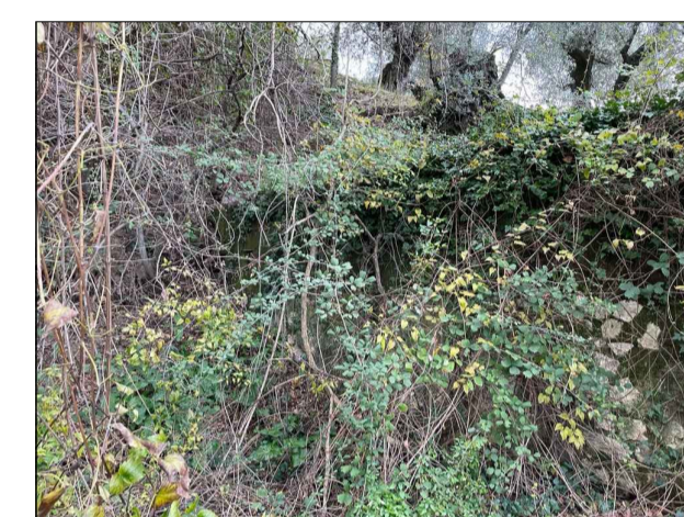
Parete laterale NORD