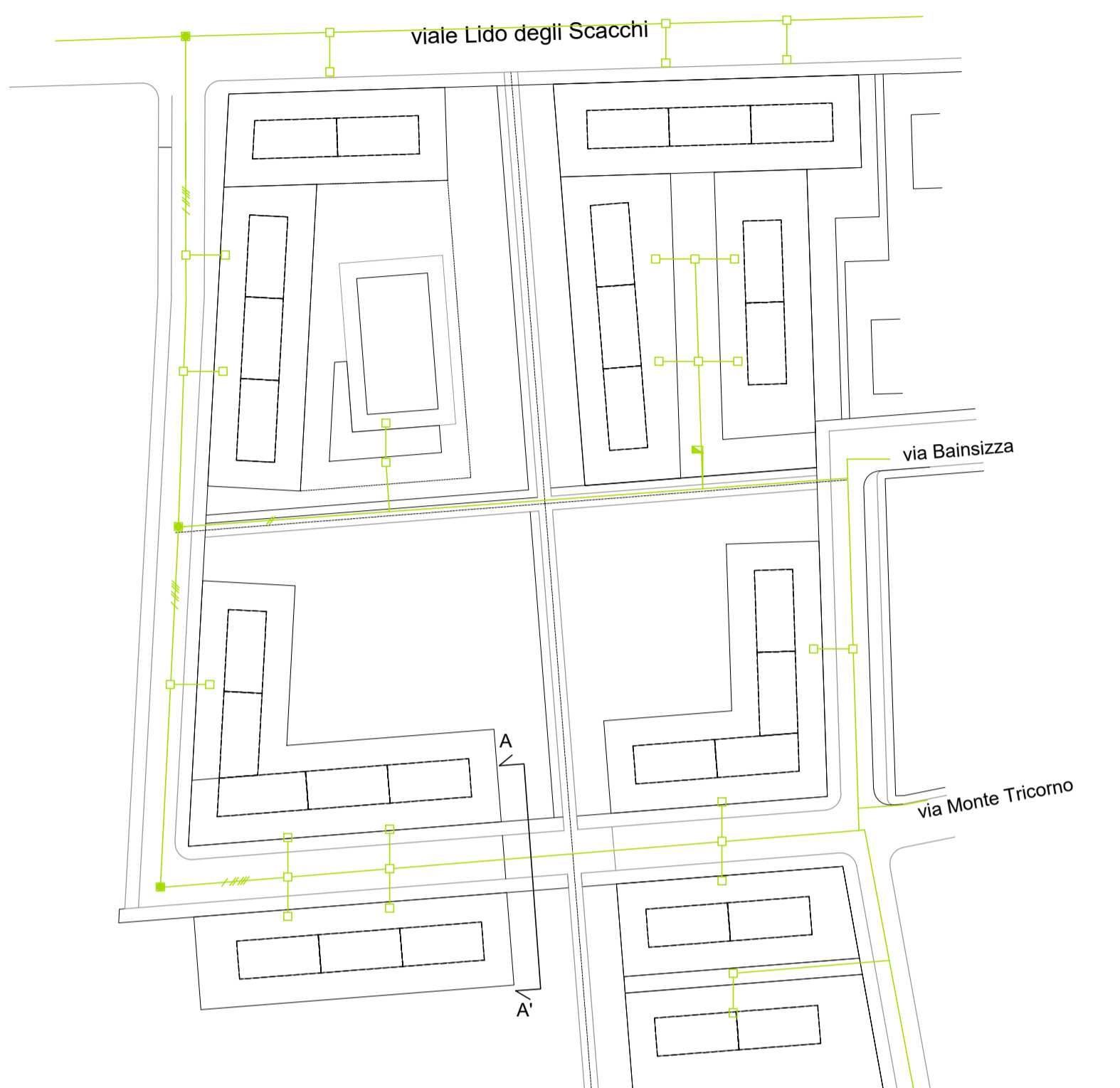
RETE ENEL scala 1:2000