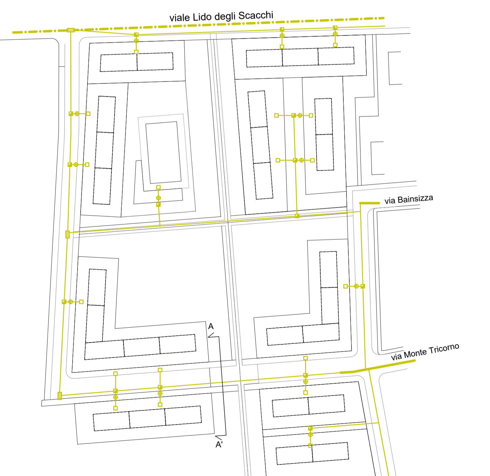
RETE TELEFONO E DATI scala 1:2000