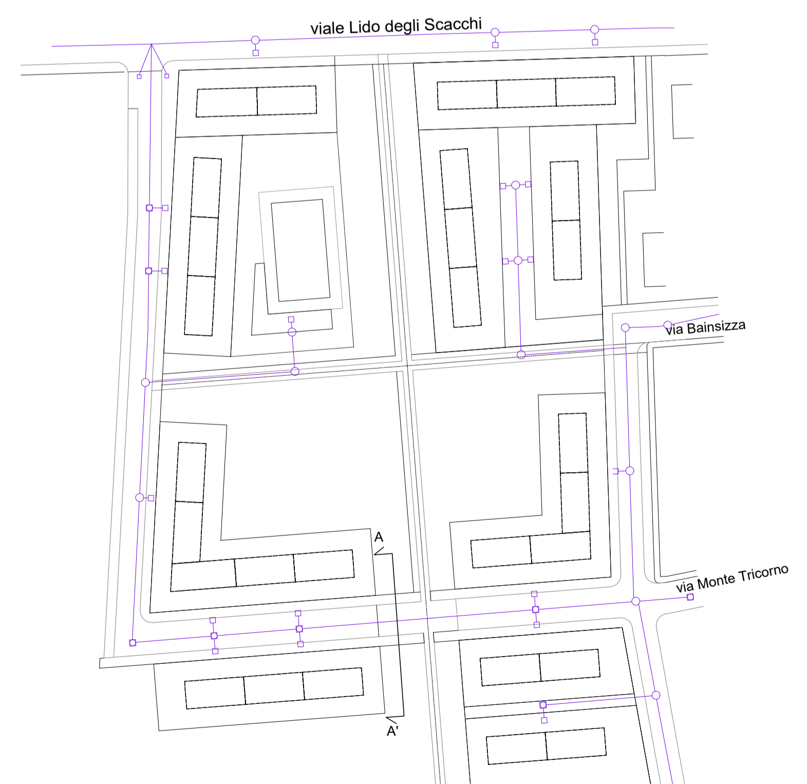
FOGNE NERE scala 1:2000