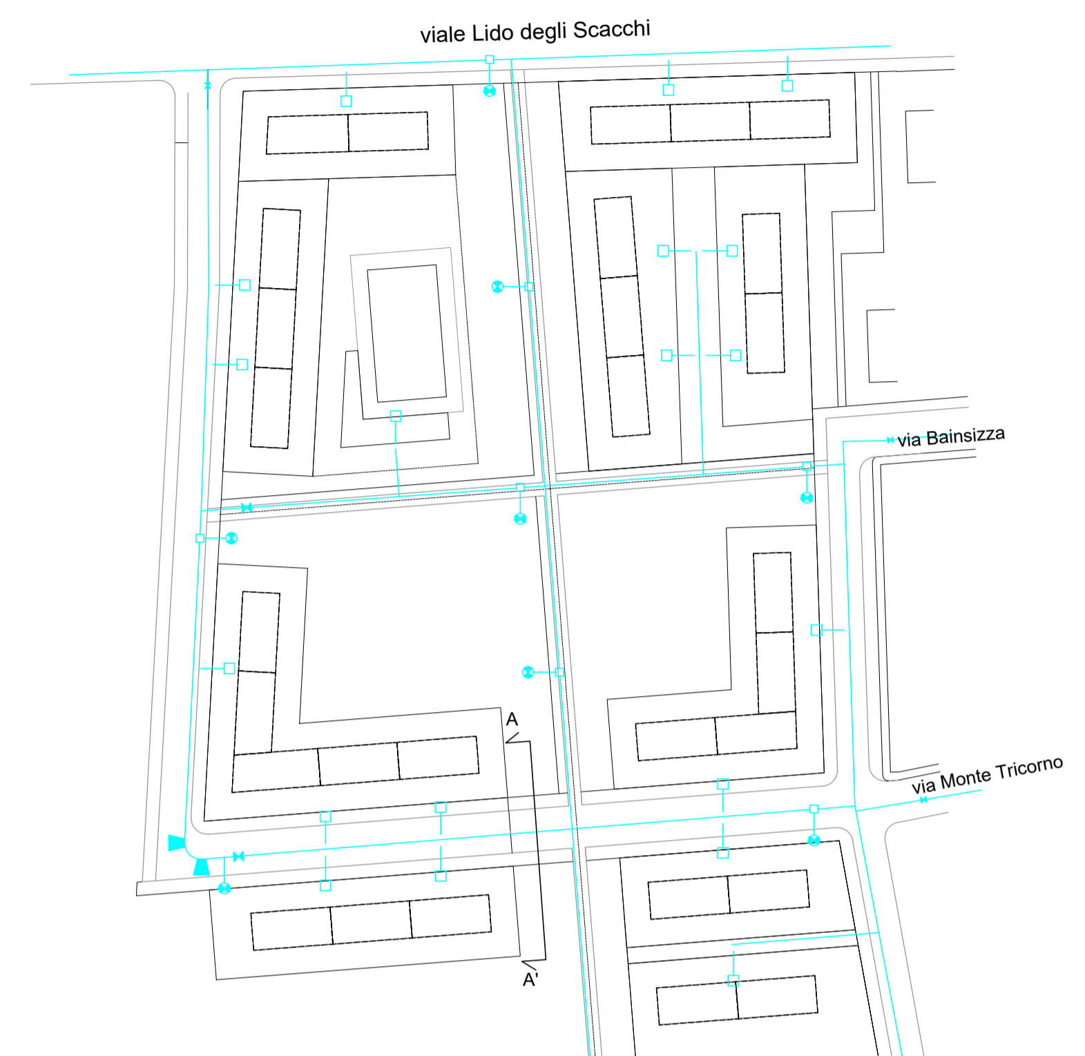
RETE IDRICA scala 1:2000