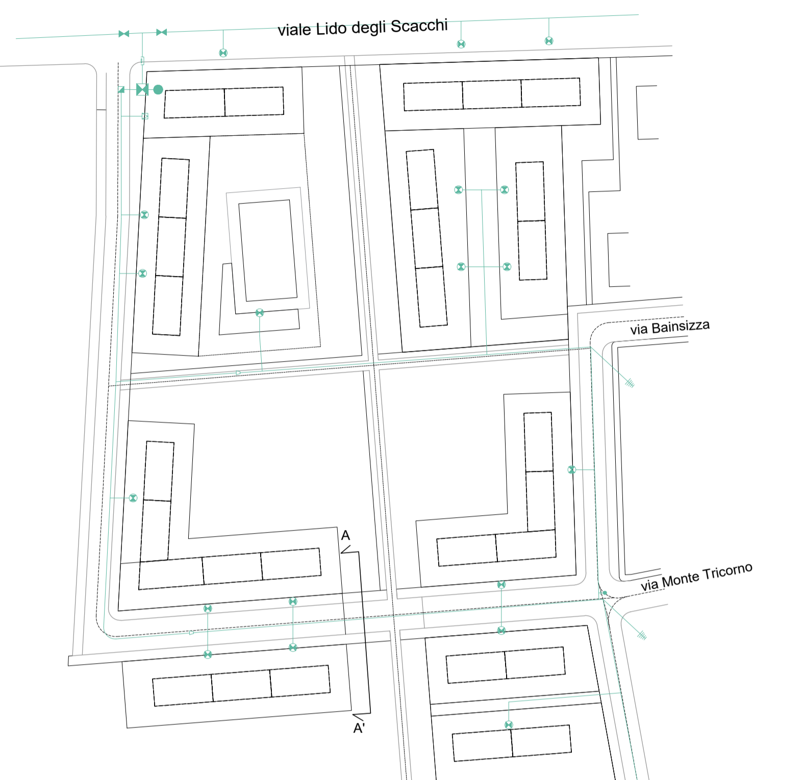
RETE GAS scala 1:2000