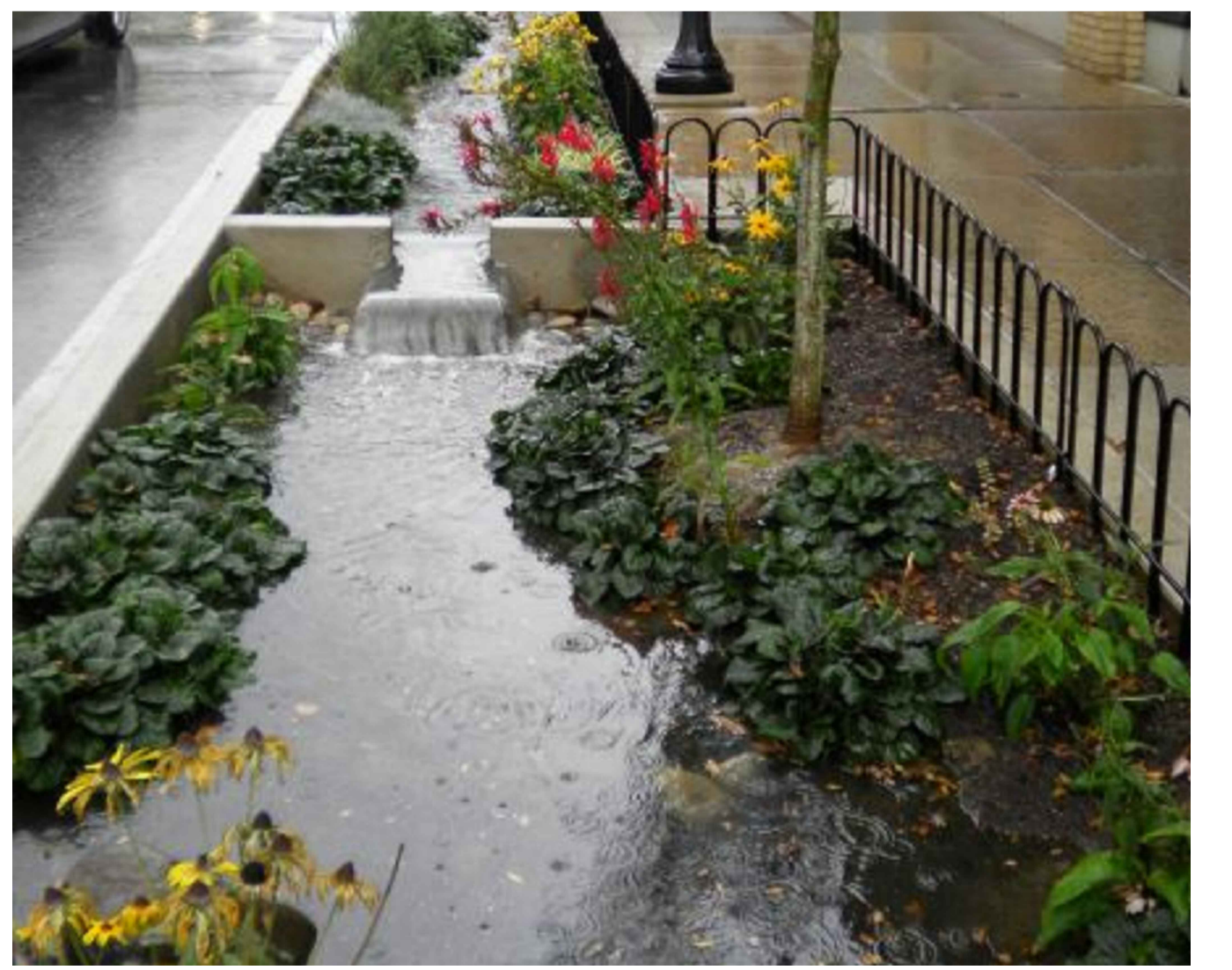
Esempio rain garden