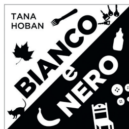
Bianco e nero Tana Hoban Editoriale Scienza