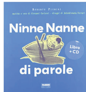
Ninne nanne di parole di Roberto Piumini, musiche e voce di Giovanni Caviezel Fabbri editori