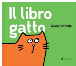
Il libro gatto Silvia Borando edizioni Minibombo