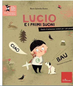
Lucio e i primi suoni Marta Galewska-Kustra edizioni Erikson