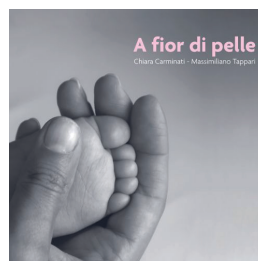
A fior di pelle Chiara Carminati, Massimiliano Tappari edizioni Lapis