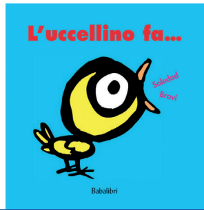
L'uccellino fa... di Soledad Bravi Babalibri editore