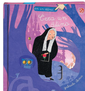
C'era un ditino Gabriele Clima edizioni La Coccinella