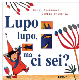
Lupo, lupo ma ci sei? Giusi Quarenghi, Giulia Orecchia Giunti Editore