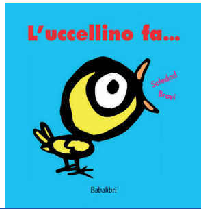
L'uccellino fa... di Soledad Bravi Babalibri editore