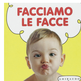
Facciamo le facce edizioni Gribaudò