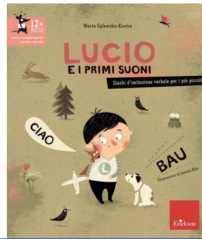
Lucio e i primi suoni Marta Galewska-Kustra edizioni Erikson