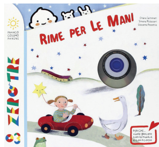
Rime per le mani Chiara Carminati edizioni Franco Cosimo Panini