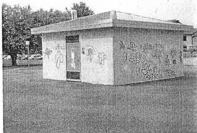
Uno degli edifici imbrattati dai vandali a Castenedolo

All'uscita avevano raggiunto il centro sportivo dove hanno sporcato i muri con simboli e scritte di vario genere, offese irripetibili alle forze dell'ordine. Se ne sono poi tornati con una certa tranquillità a casa, convinti di non essere scoperti. Un'azione premeditata visto che poi i vandali hanno ammesso di aver comperato un giorno prima le bombolette spray. I carabinieri però si sono messi con pazienza sulle tracce dei