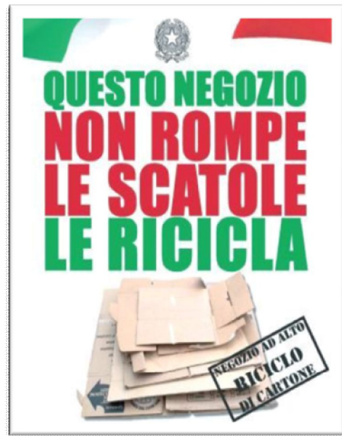
Locandine per esercizi commerciali