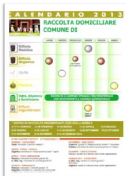
Calendario di raccolta

La brochure informativa dovrà contenere le seguenti informazioni: