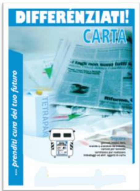
Manifesti per la popolazione