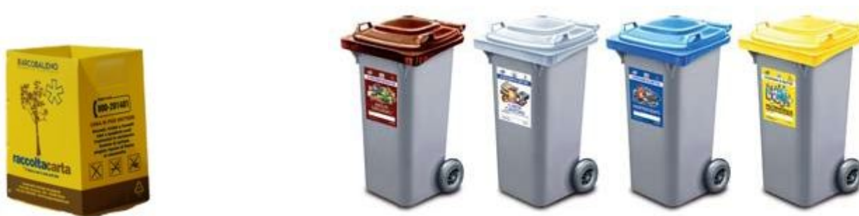
Attrezzature di raccolta a disposizione degli istituti

Previo accordo con i dirigenti scolastici, a completamento delle lezioni teoriche, è possibile prevedere l'introduzione di cestini "solo carta", "solo plastica" e "solo vetro/metallo" a disposizione delle classi coinvolte nel progetto. Un ulteriore contenitore per la raccolta della plastica potrà essere predisposto nel locale mensa per la raccolta delle bottiglie di plastica derivanti dal pranzo.