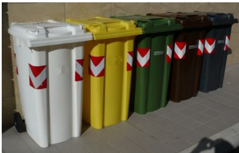
Figura 2: Kit contenitori 240 l