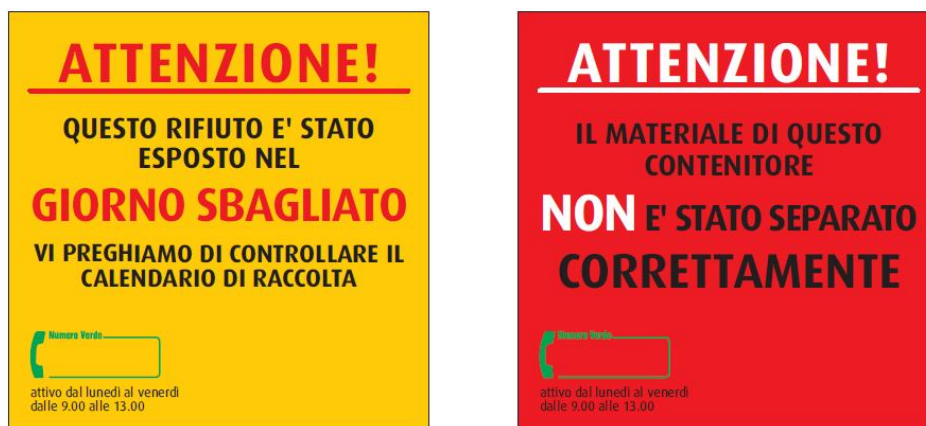
Figura 3: Ticket errori di conferimento

In fase di raccolta gli operatori monitoreranno il corretto comportamento dell'utente e saranno dotati di appositi ticket di comunicazione con cui avviseranno l'utente circa eventuali errori di conferimento; in particolare le casistiche di errori più frequenti riscontrate in fase di raccolta riguardano i conferimenti di materiali non conformi e l'esposizione dell'attrezzatura nel giorno errato.