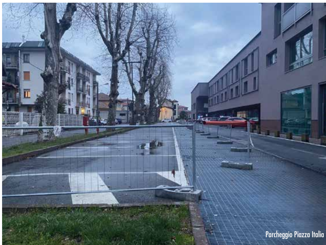
Parcheggio Piazza Italia

GRUPPO DI MINORANZA ALTERNATIVA PER OLGIATE