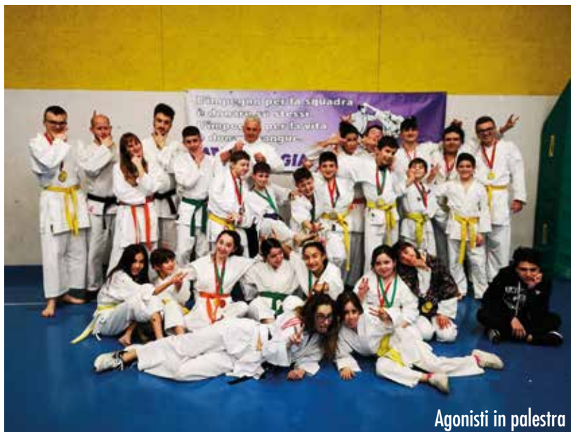
Agonisti in palestra

Una trasferta che è servita ai nostri Atleti anche per crescere e per coltivare amicizie perché, anche se il Karate è uno “Sport Individuale”, quello che più interessa a noi è che i ragazzi siano “Squadra”, deve esserci una “sana competizione sul tatami”, ma non al di fuori, in palestra e nella vita si sono creati rapporti di Amicizia che per noi valgono più di mille Medaglie.