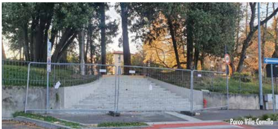
Parco Villa Camilla

Come in diverse occasioni rappresentato, il gruppo di minoranza chiede una maggiore sensibilizzazione da parte dell'Amministrazione Comunale nel rispetto di quanto previsto