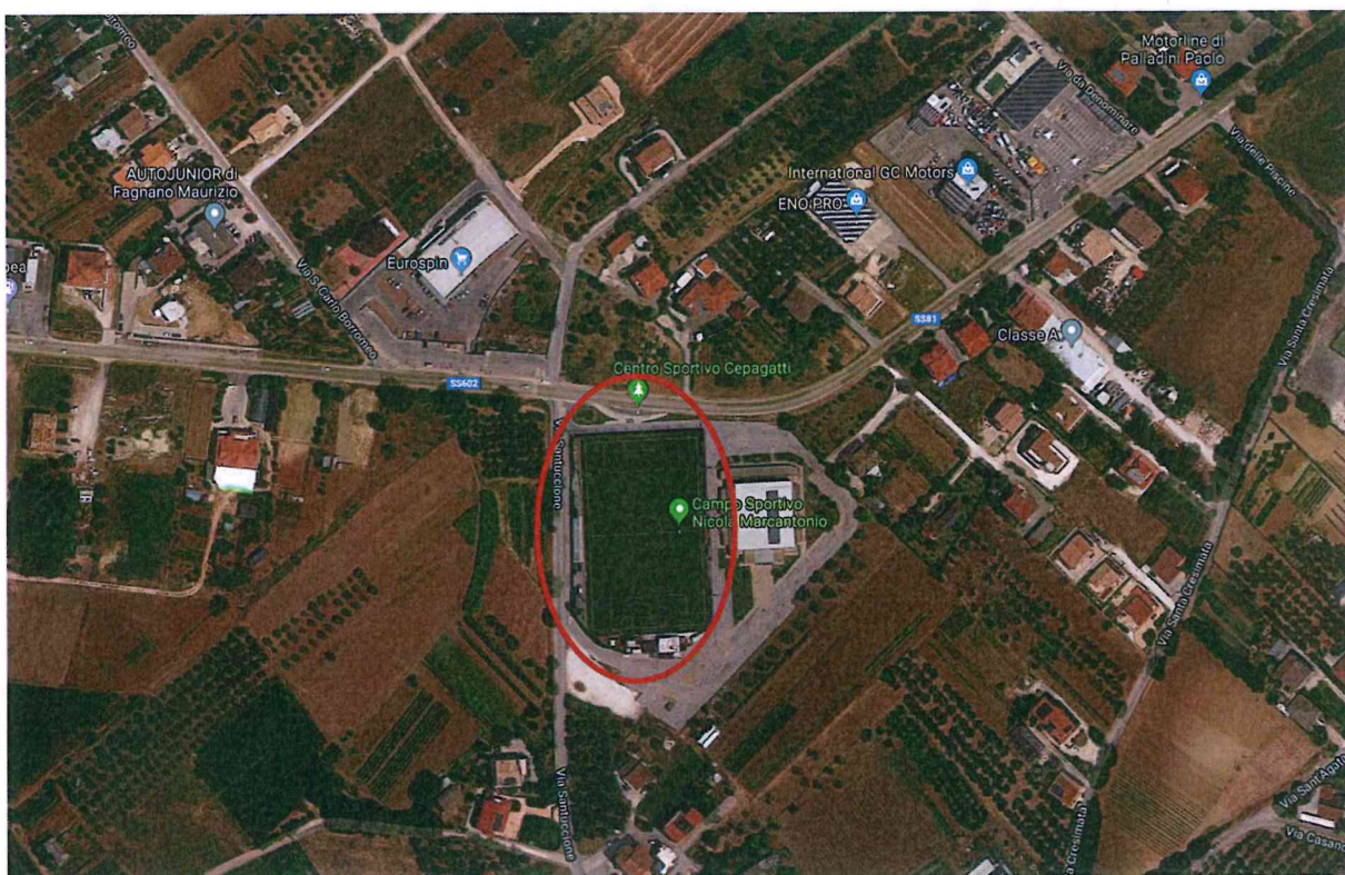
STRALCIO FOTOAEROGRAFICO – GEOPORTALE NAZIONALE

L'area oggetto di intervento è ubicato nel Comune di Cepagatti (PE) in Via Santuccione, censito al catasto al fig. 21 p.lla 1066 ed è localizzata nella prima periferia del paese. E' facilmente raggiungibile a piedi ed in bici vista la sua ubicazione. Attualmente tale area è composta da verde pubblico , dal palazzetto dello sport, dal campo sportivo con annessi locali e dal parcheggio di pertinenza degli stessi.