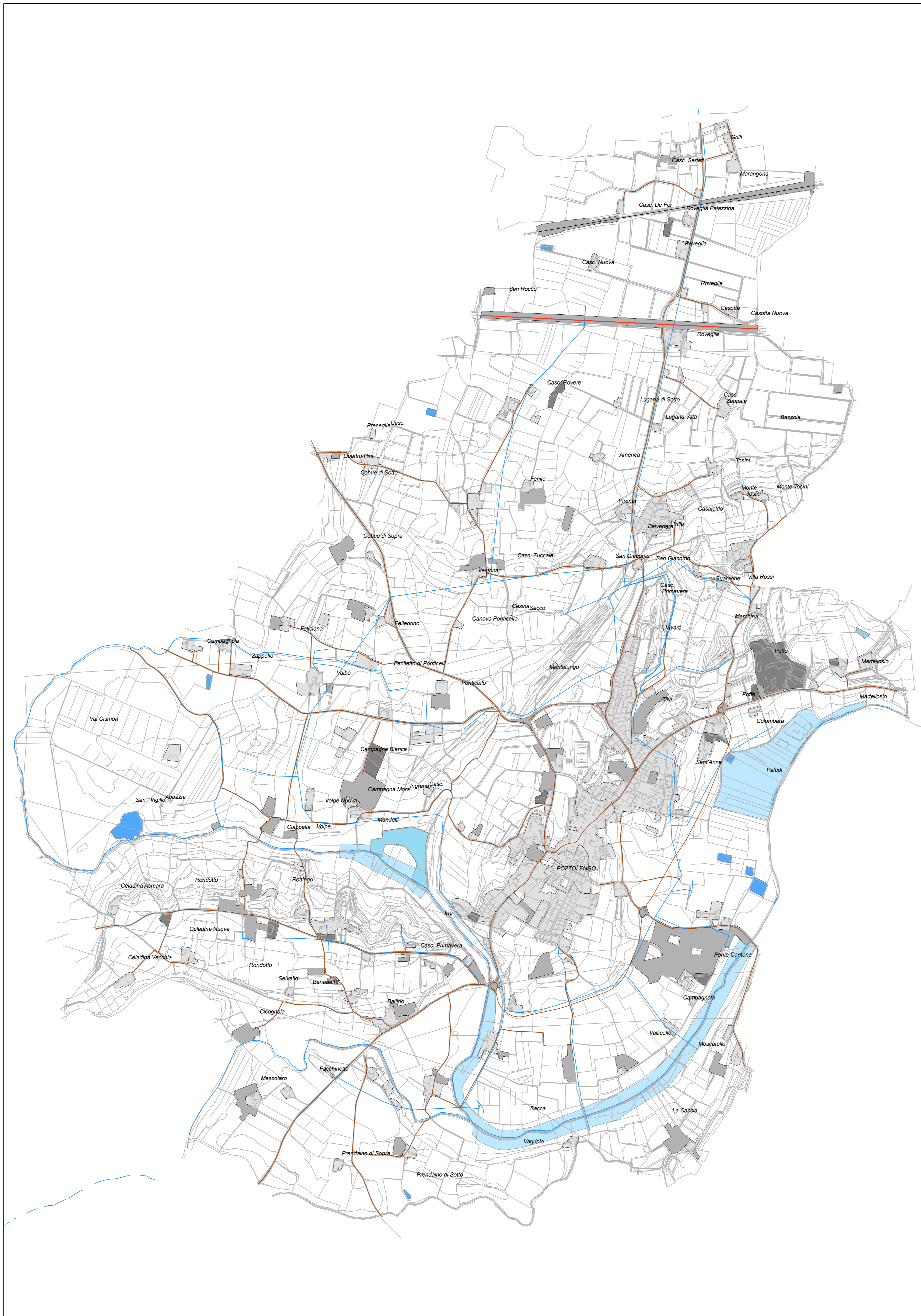
DETTAGLIO ZONA COLPITA URBANIZZATA - Scala 1:2.000