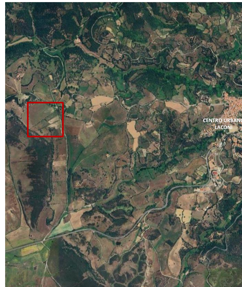
Figura 2 - Localizzazione su ortofoto dei terreni interessati