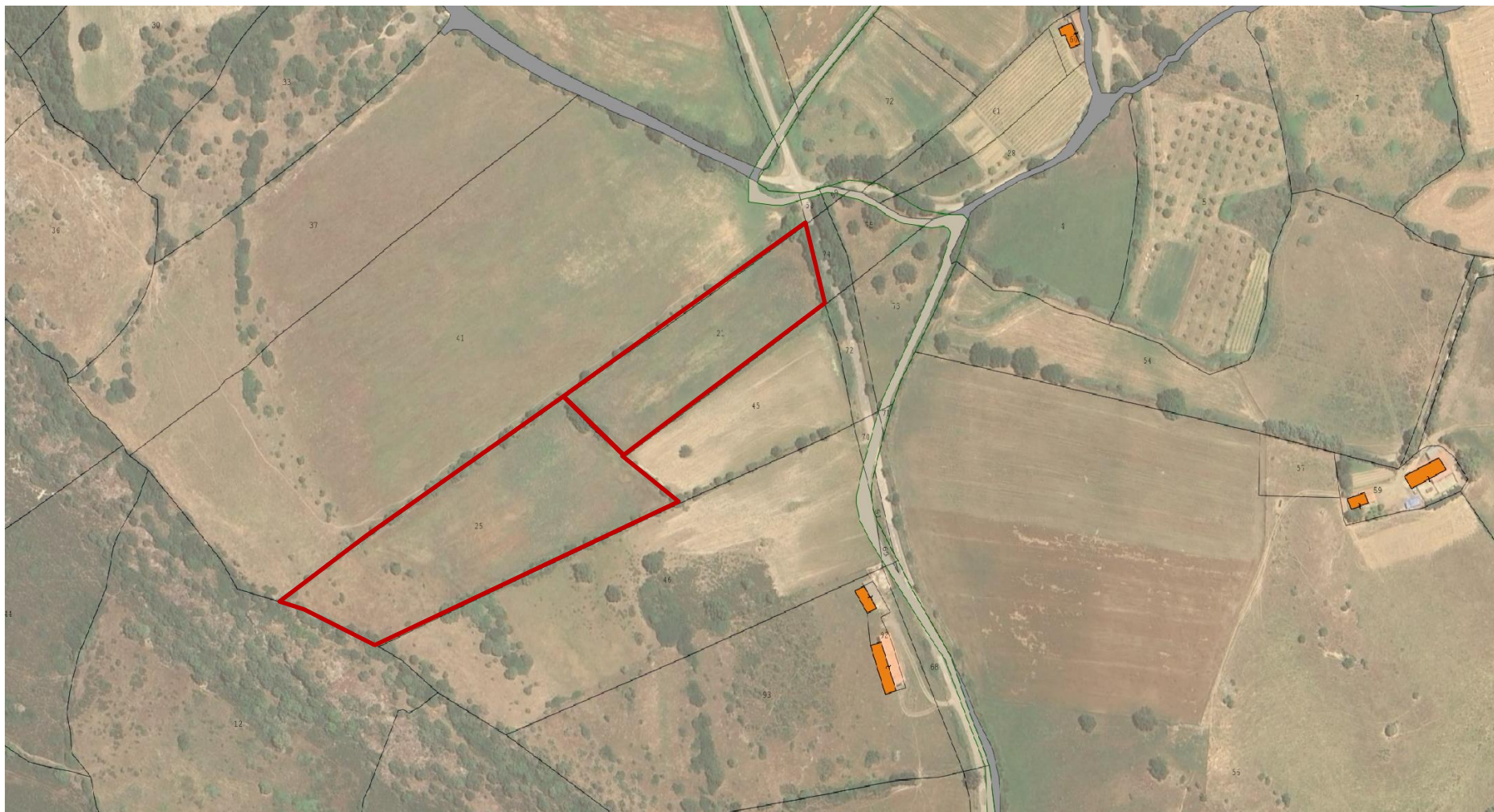
Figura 3 - Planimetria Catastale con individuazione delle particelle 21 e 25 su Aerofotogrammetrico