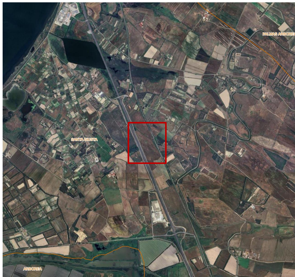
Figura 2 - Localizzazione su ortofoto dei terreni interessati