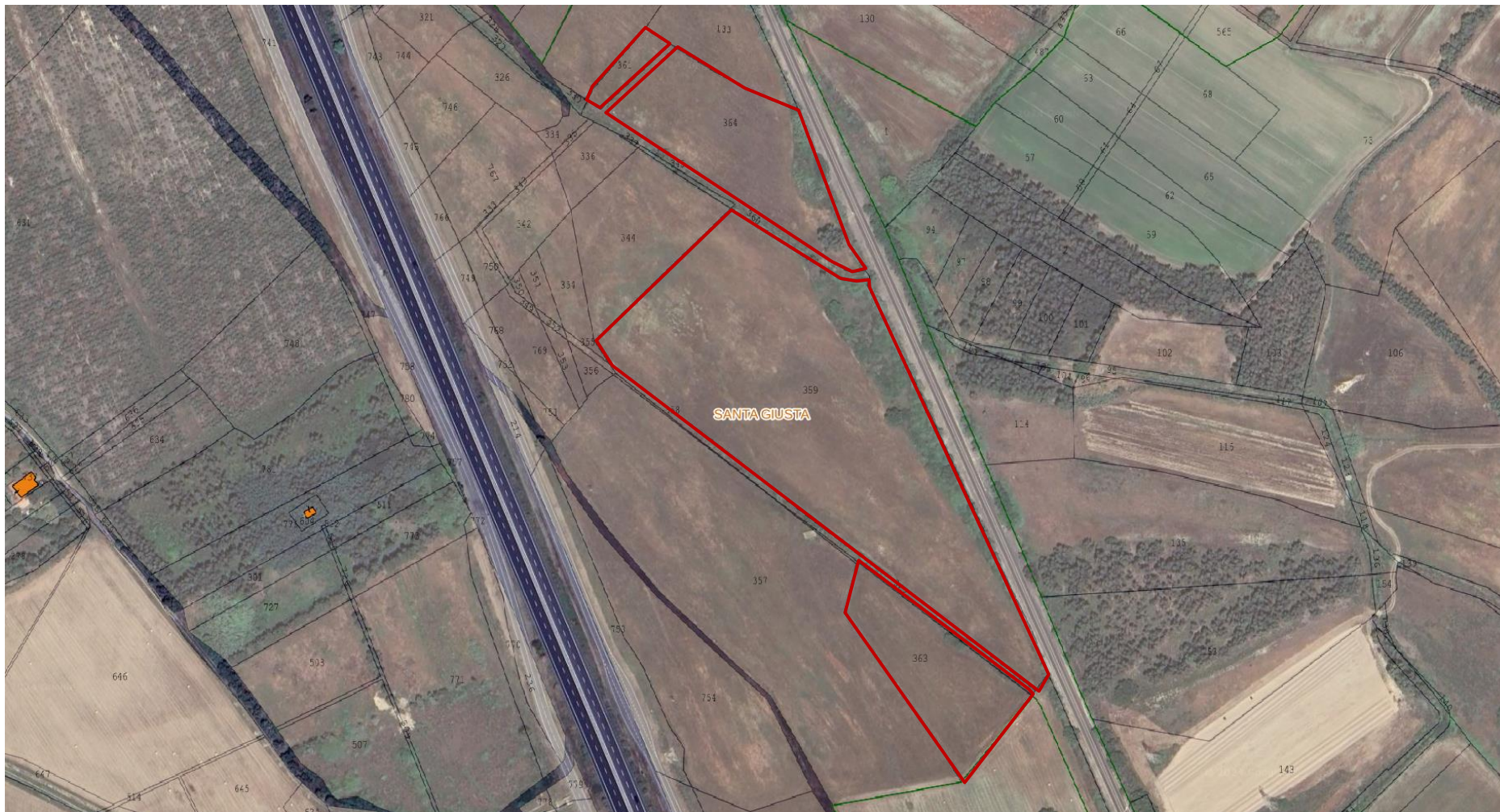
Figura 3 - Planimetria Catastale con individuazione delle particelle 359-361-363-364 su Aerofotogrammetrico