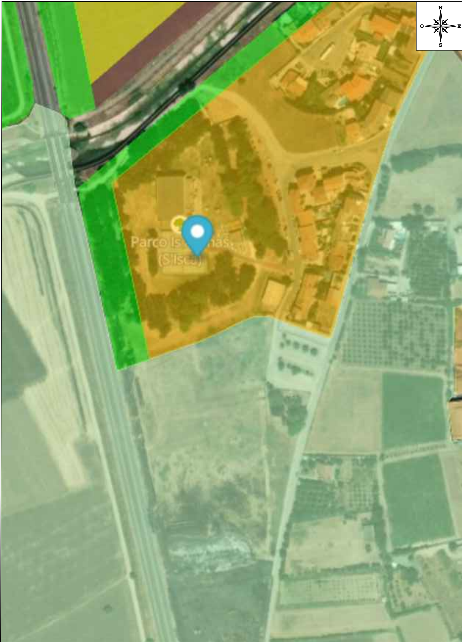
PIANO URBANISTICO COMUNALE Scala 1: 2 000