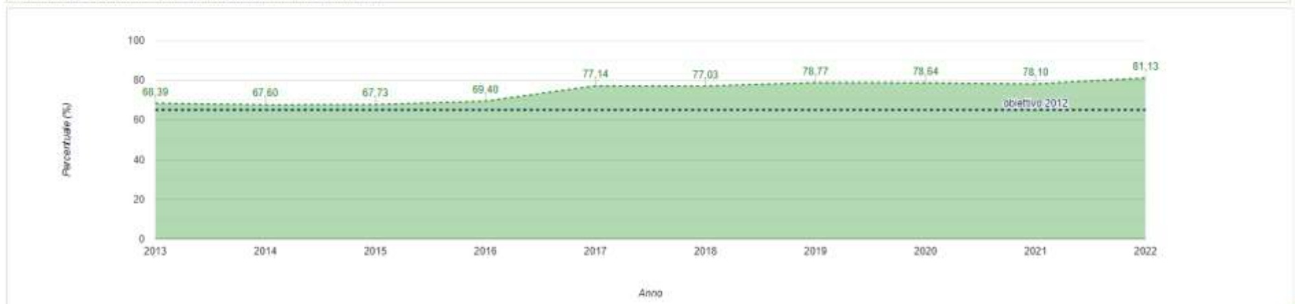
Andamento della percentuale di raccolta differenziata - Comune di Villaurbana

Utilizzando il pulsante è possibile esportare la tabella in formato csv Esporta tabella