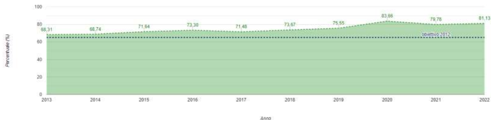
Andamento della percentuale di raccolta differenziata - Comune di Siamaggione

Utilizzando il pulsante è possibile esportare la tabella in formato csv Esporta tabella