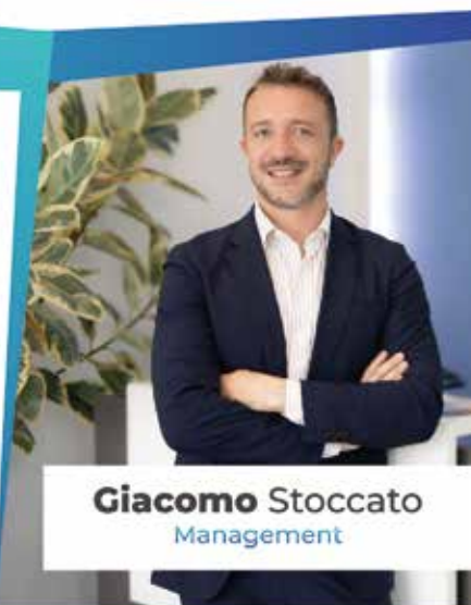
Giacomo Stoccato Management

Via Varese 29H, 21047 Saronno (VA) +39 02 8277 3782 - www.grupphomega.it