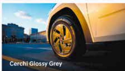
Cerchi Glossy Grey

Solo con permuta o rottamazione e finanziamento Hyundai Plus.