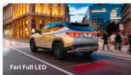
Fari Full LED

È arrivata Nuova Hyundai TUCSON Dark Line. Scegli l'eleganza del nero, in ogni dettaglio. Ti aspettiamo in concessionaria.