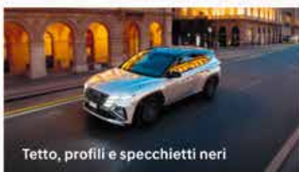
Tetto, profili e specchietti neri