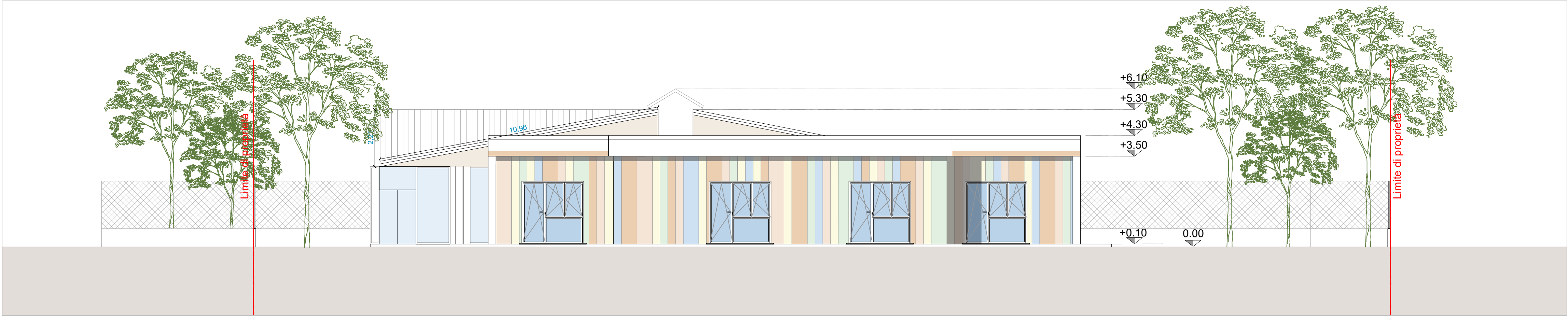
Prospetto OVEST_Stato di progetto - 1:100