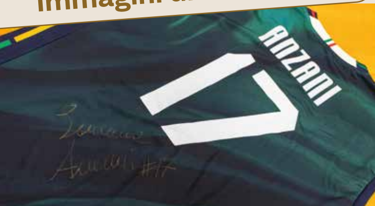
La maglietta del titolo mondiale donata al Comune