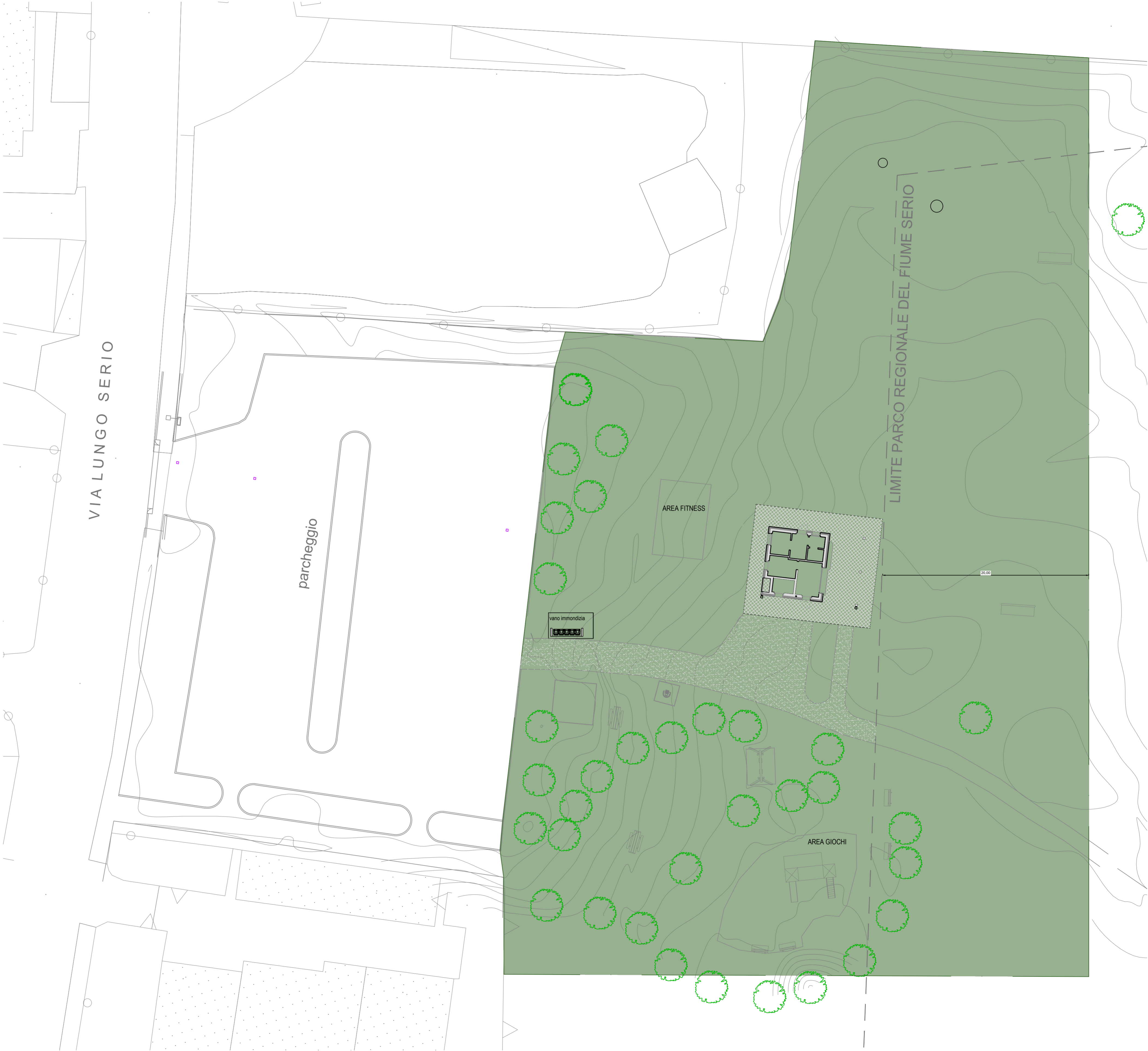
PLANIMETRIA GENERALE scala 1:200

A termine di legge lo STUDIO CARMINATI si riserva tutti i diritti e le proprietà di questo disegno con la proibizione di riprodurlo