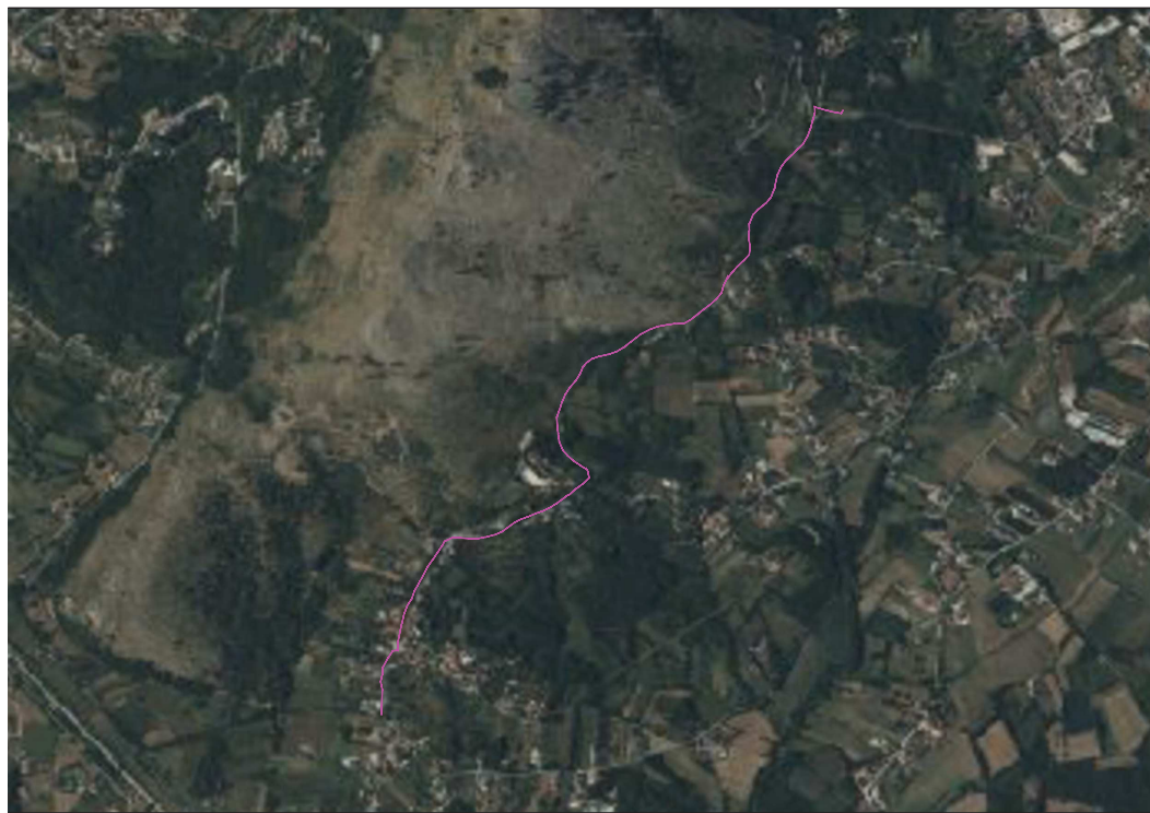
RTOFOTO - Scala 1:5000