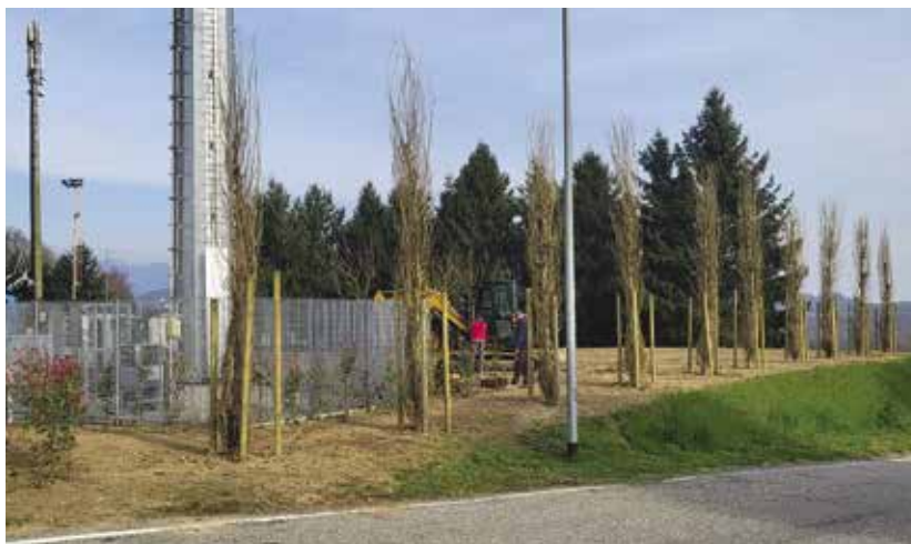
Località: parcheggio campo di calcio, via Borgonovo