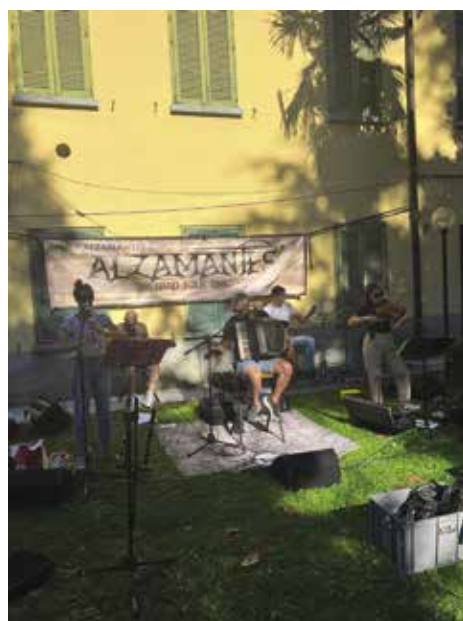
Villa Raschi a Ronago