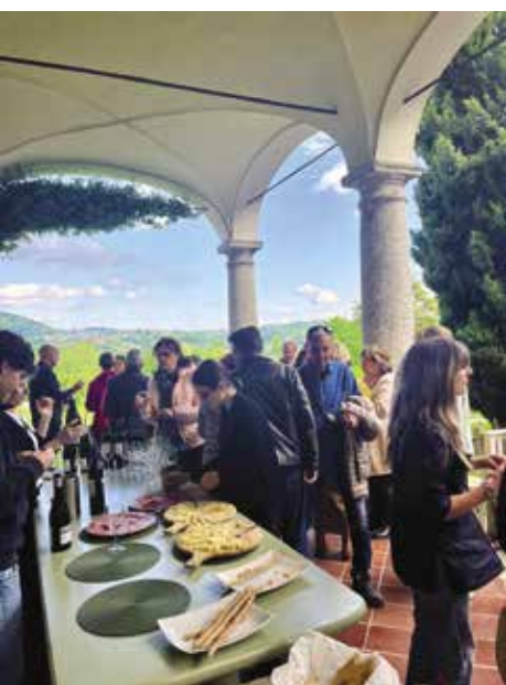
Villa Natta di Romazzana

Per il 2026osterremo questo progetto in un'unica manifestazione da svolgersi presumibilmente in primavera: località e tipologia dell'evento sono ancora in fase di definizione.