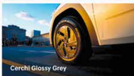
Cerchi Glossy Grey