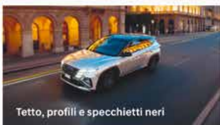
Tetto, profili e specchietti neri