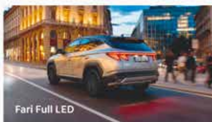
Fari Full LED

È arrivata Nuova Hyundai TUCSON Dark Line. Scegli l'eleganza del nero, in ogni dettaglio. Ti aspettiamo in concessionaria.