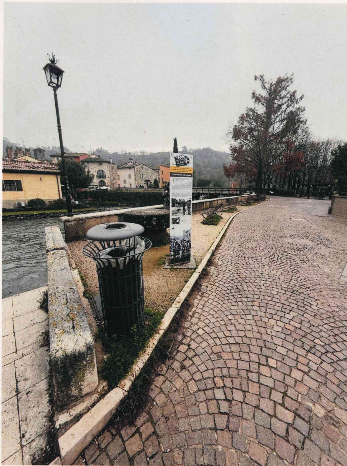
Vista da via Giotto verso via Michelangelo Buonarroti

STUDIO ARCHITETTURA L.O.A. srl -via Don Gregorio Segala 55/a -37139 Verona tel.0458905106