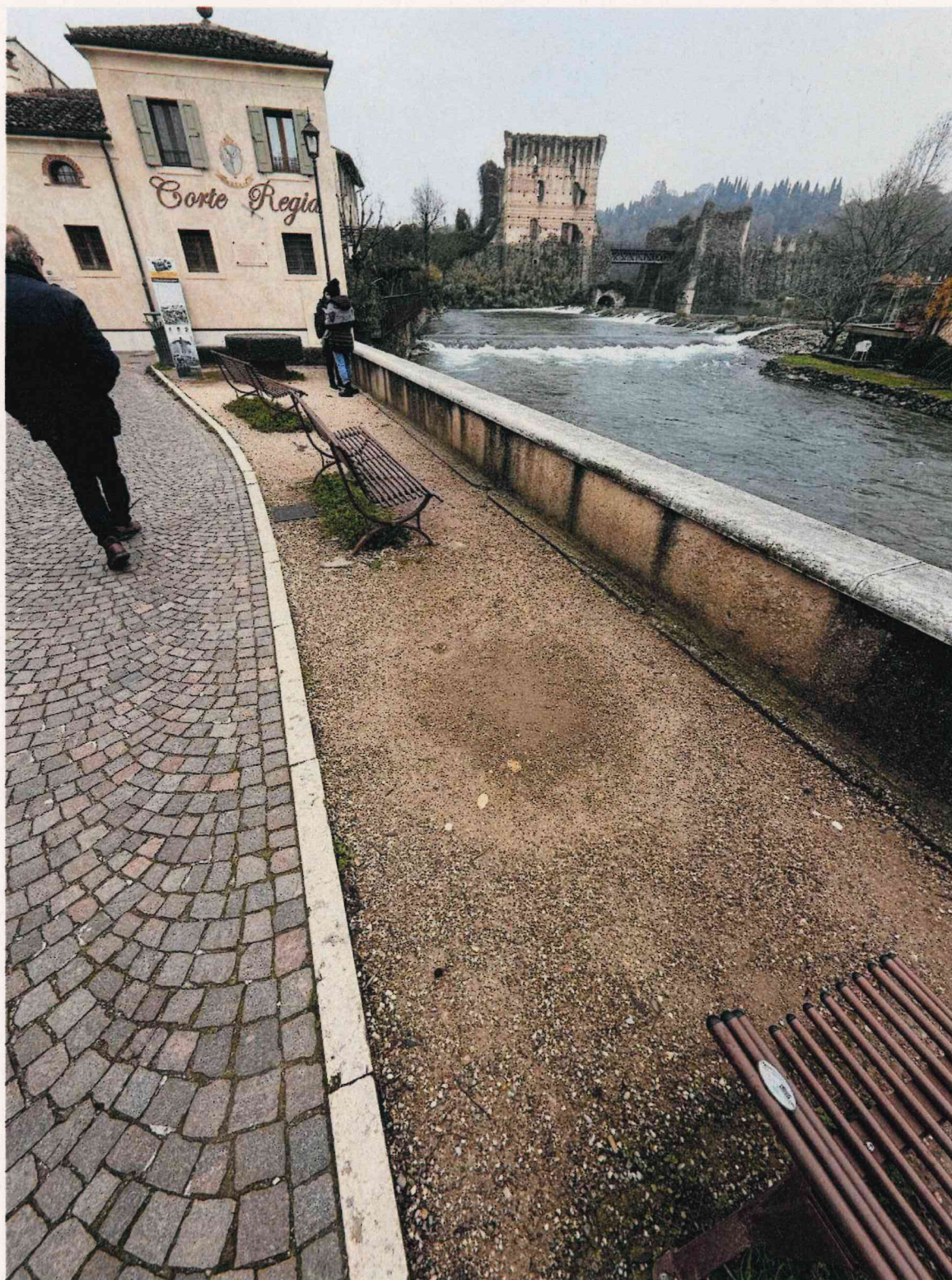
Vista da via Michelangelo Buonarroti verso via Giotto -sud

STUDIO ARCHITETTURA L.O.A. srl -via Don Gregorio Segala 55/a -37139 Verona tel.0458905106