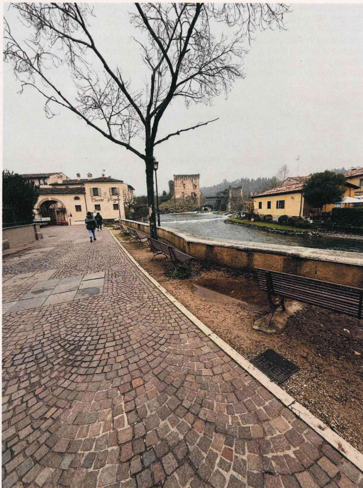
Vista da via Michelangelo Buonarroti verso via Giotto-sud

STUDIO ARCHITETTURA L.O.A. srl -via Don Gregorio Segala 55/a -37139 Verona tel.0458905106