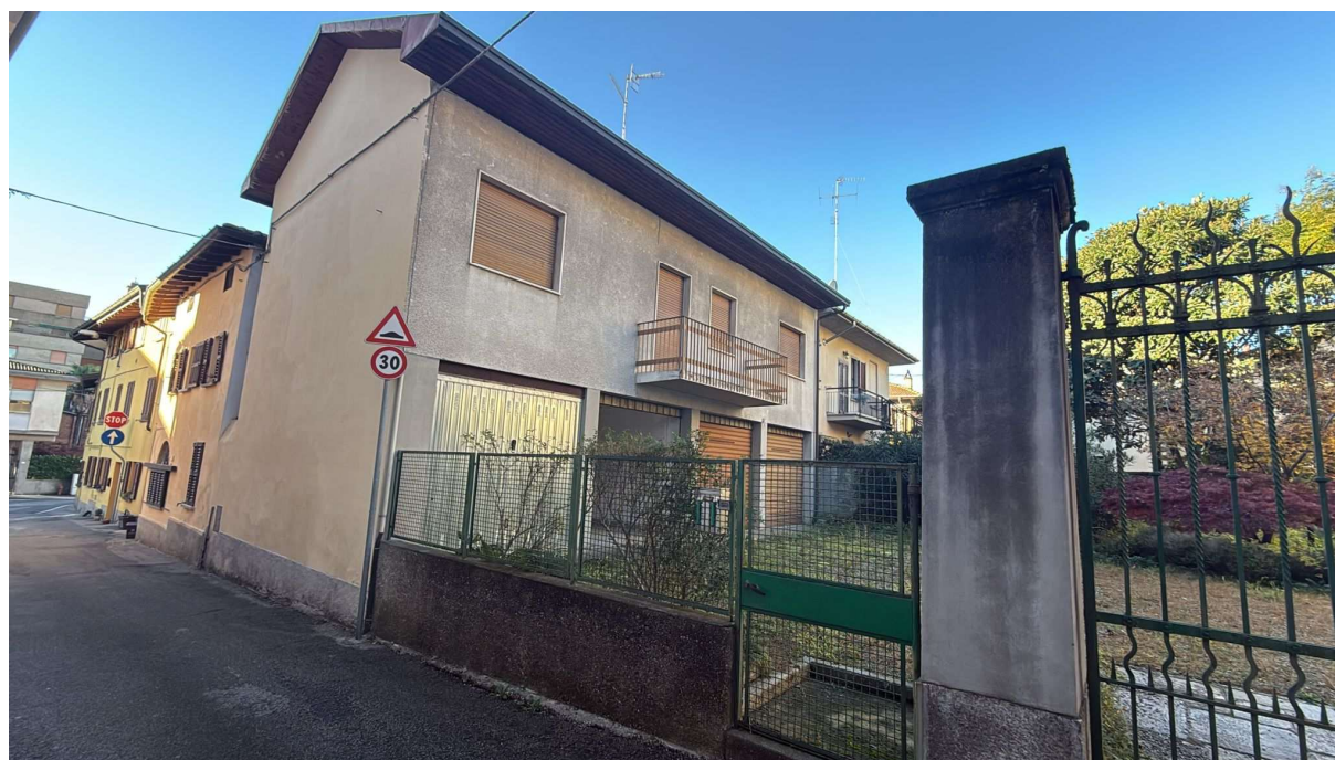
Via Carlo Gerosa