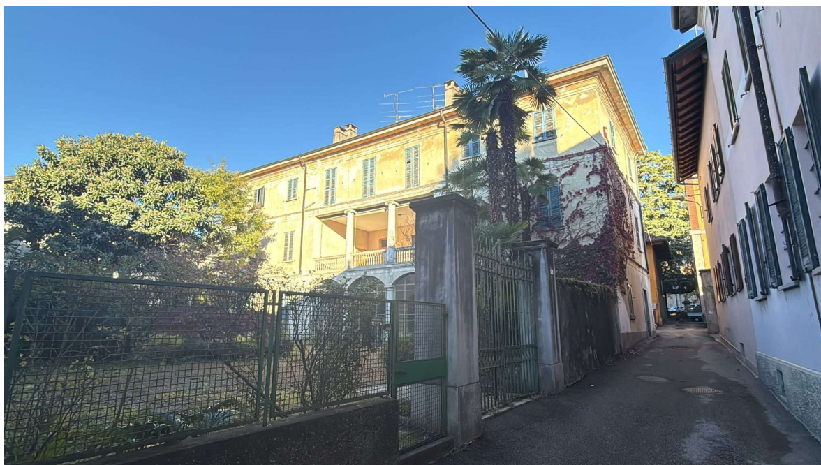
Via Carlo Gerosa