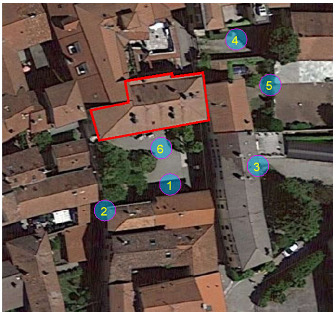
Estratto immagine satellitare