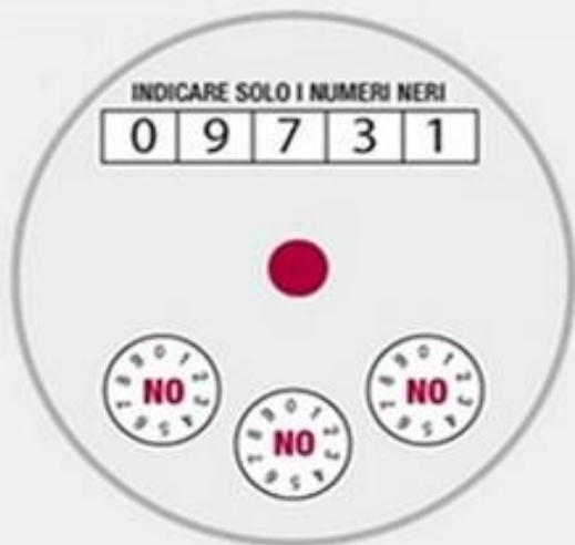
Contatore a lettura diretta