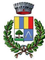
Comune di Aritzo