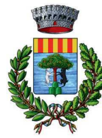
Comune di Tonara