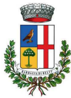
Comune di Belvì