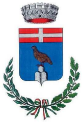
Comune di Gadoni