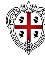
REGIONE AUTÒNOMA DE SARDIGNA REGIONE AUTONOMA DELLA SARDEGNA