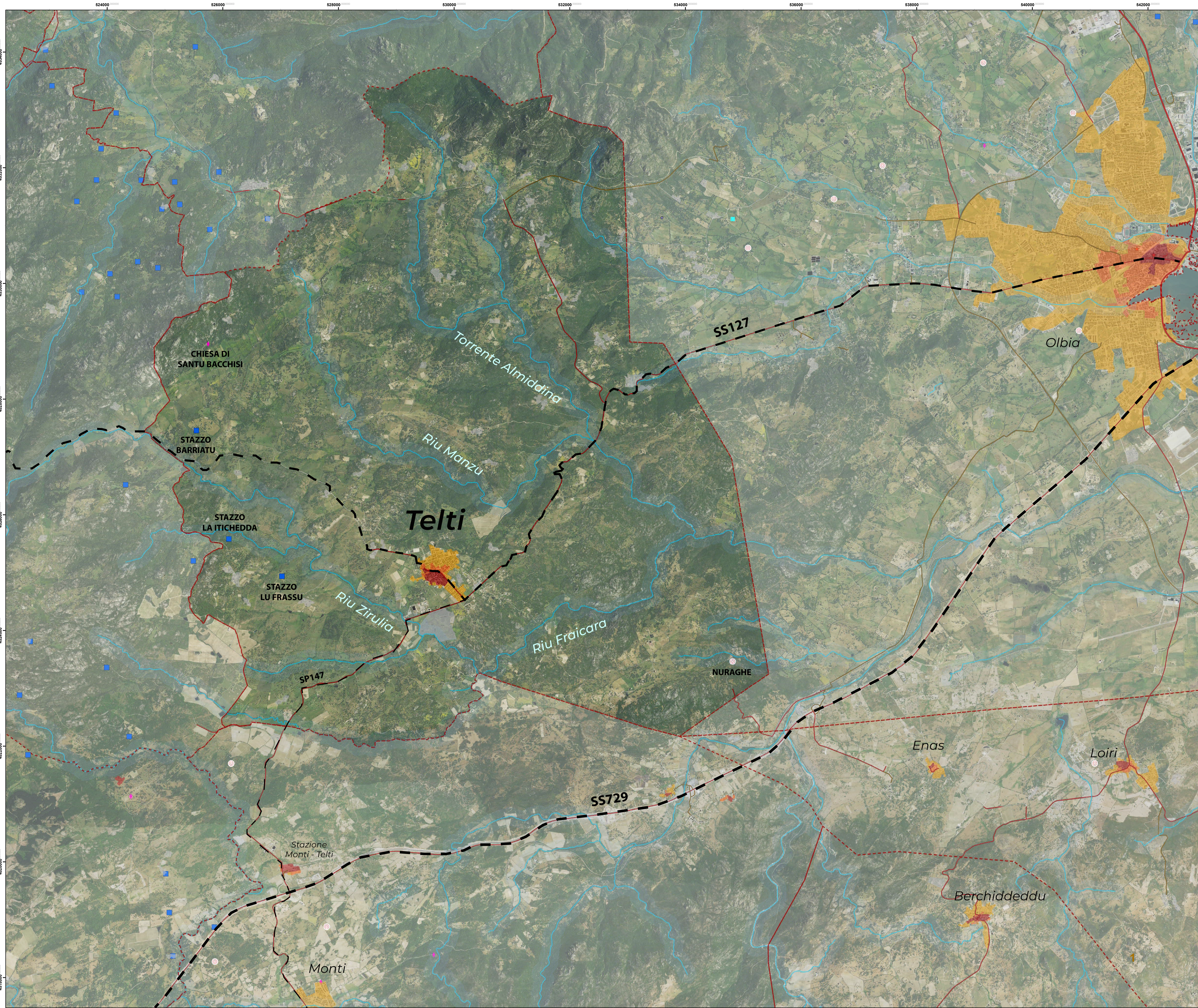
Inquadramento territoriale 1:25.000