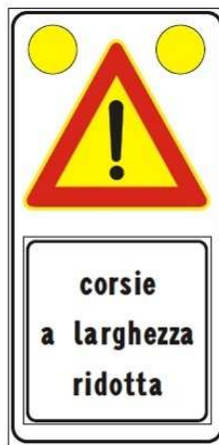
Figura Il 391c Art. 31