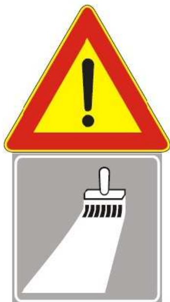
Figura Il 391 Art. 31