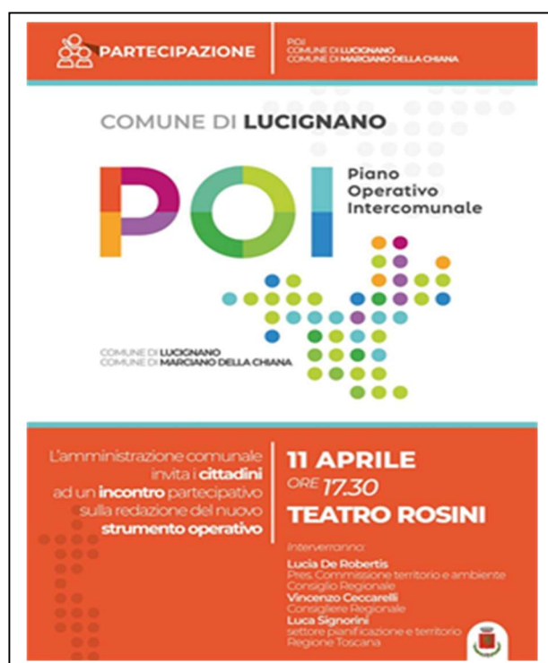
Locandine eventi partecipativi