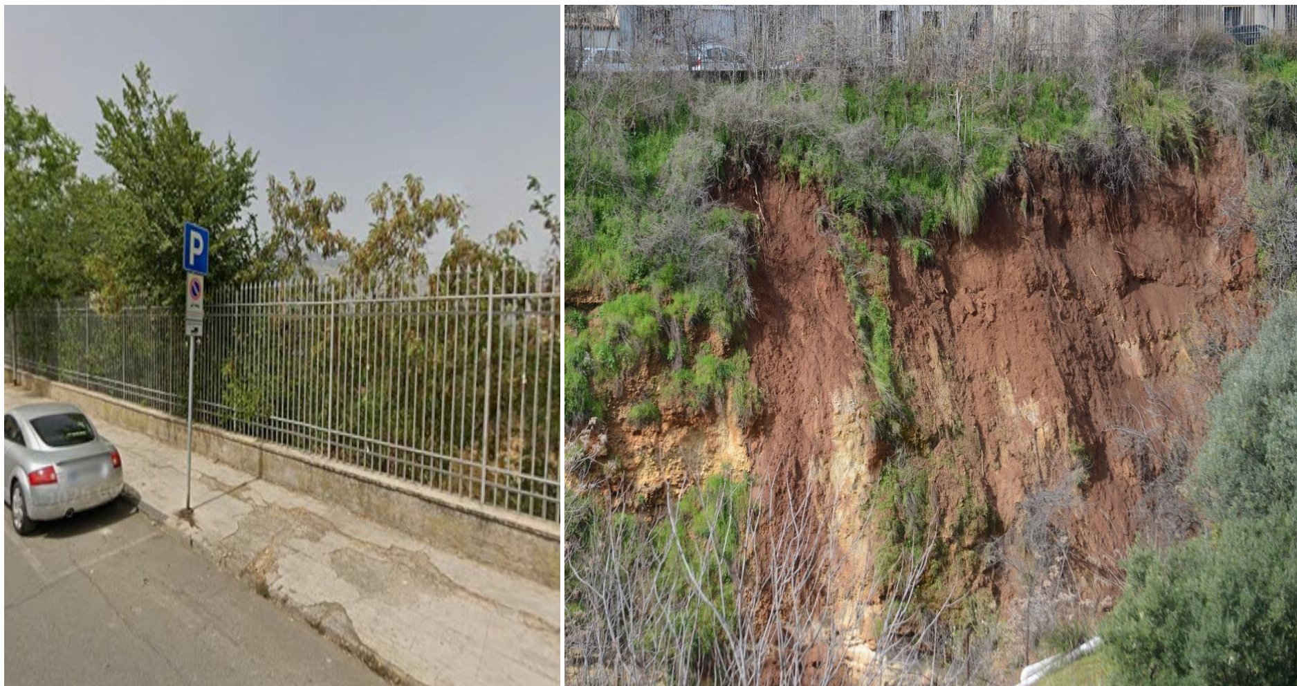
Figure 5 PUNTO CRITICO 3 AL 15.02.2026

INDIFFERIBILE MESSA IN CAMPO DI MISURE DI MITIGAZIONE DEL RISCHIO DI DISSESTO DEL VERSANTE DEL CANAL GRECO CHE INTERESSA LA VIA MAZZINI NELL'ABITATO DI CASTROVILLARI, PER CHIARA EVOLUZIONE IN ATTO DEL QUADRO DI DISSESTO IDROGEOLOGICO COSTITUENTE POTENZIALE PERICOLO PER LA INCOLUMITA' PUBBLICA.