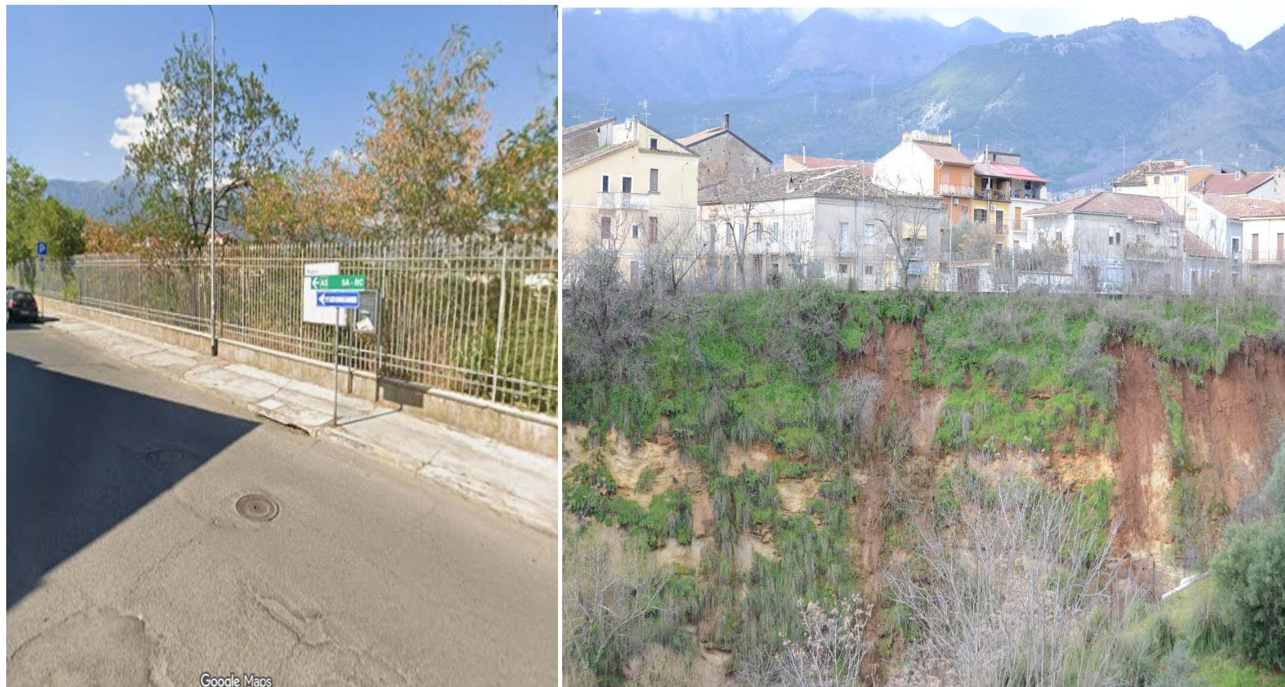
Figure 4 PUNTO CRITICO 2 AL 15.02.2026

INDIFFERIBILE MESSA IN CAMPO DI MISURE DI MITIGAZIONE DEL RISCHIO DI DISSESTO DEL VERSANTE DEL CANAL GRECO CHE INTERESSA LA VIA MAZZINI NELL'ABITATO DI CASTROVILLARI, PER CHIARA EVOLUZIONE IN ATTO DEL QUADRO DI DISSESTO IDROGEOLOGICO COSTITUENTE POTENZIALE PERICOLO PER LA INCOLUMITA' PUBBLICA.