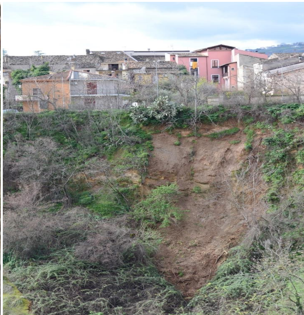
Figure 1 PUNTO CRITICO 1