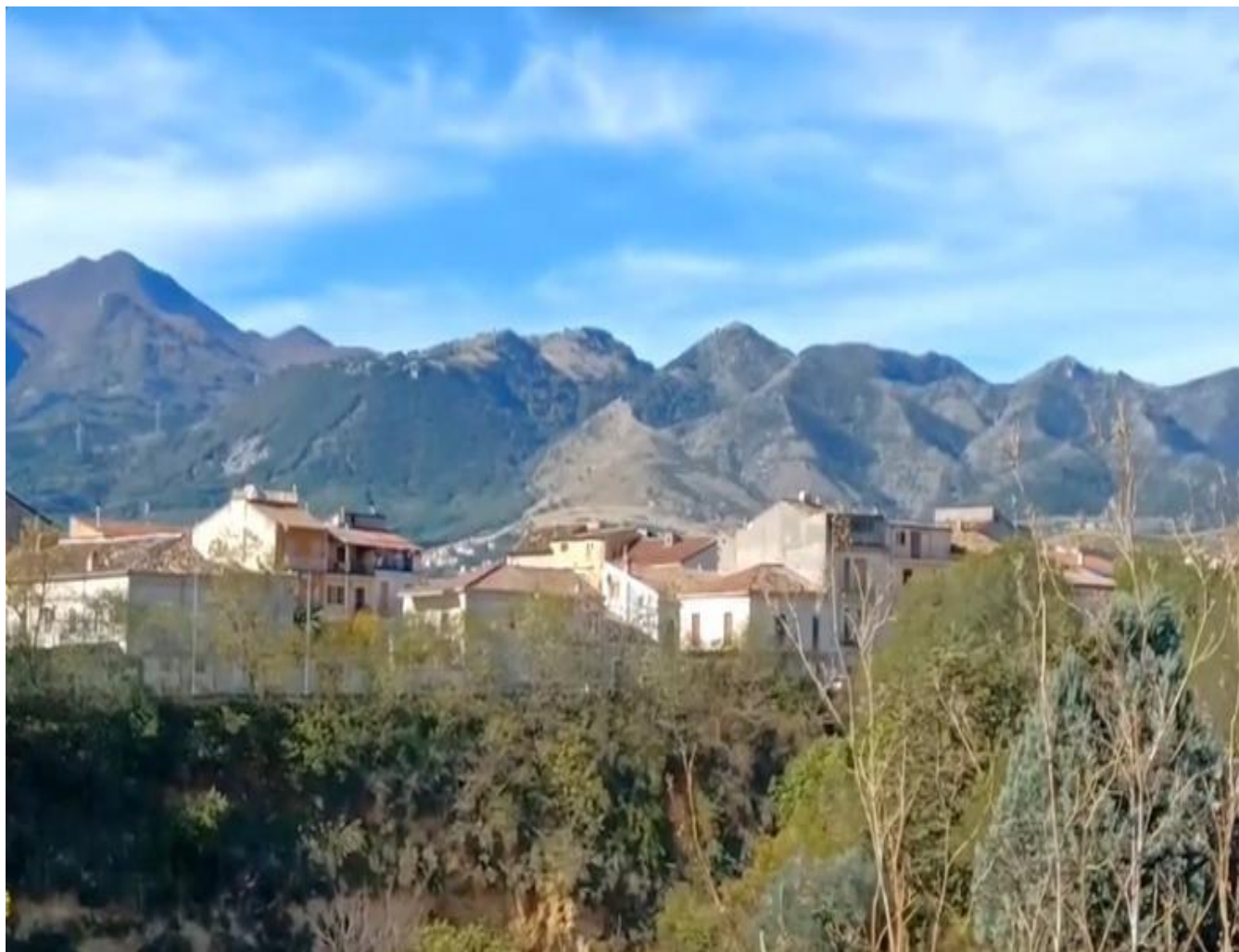
Figure 7 PUNTO CRITICO 2/3 AL 19.07.2023

INDIFFERIBILE MESSA IN CAMPO DI MISURE DI MITIGAZIONE DEL RISCHIO DI DISSESTO DEL VERSANTE DEL CANAL GRECO CHE INTERESSA LA VIA MAZZINI NELL'ABITATO DI CASTROVILLARI, PER CHIARA EVOLUZIONE IN ATTO DEL QUADRO DI DISSESTO IDROGEOLOGICO COSTITUENTE POTENZIALE PERICOLO PER LA INCOLUMITA' PUBBLICA.