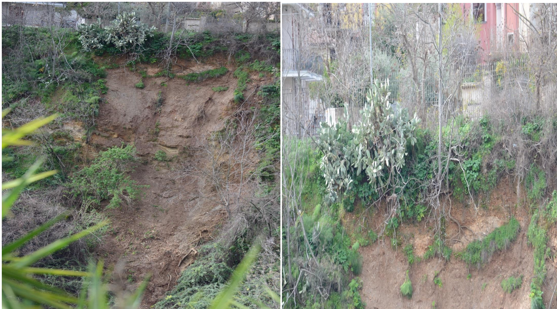
Figure 2 PUNTO CRITICO 1 AL 15.02.2026

INDIFFERIBILE MESSA IN CAMPO DI MISURE DI MITIGAZIONE DEL RISCHIO DI DISSESTO DEL VERSANTE DEL CANAL GRECO CHE INTERESSA LA VIA MAZZINI NELL'ABITATO DI CASTROVILLARI, PER CHIARA EVOLUZIONE IN ATTO DEL QUADRO DI DISSESTO IDROGEOLOGICO COSTITUENTE POTENZIALE PERICOLO PER LA INCOLUMITA' PUBBLICA.