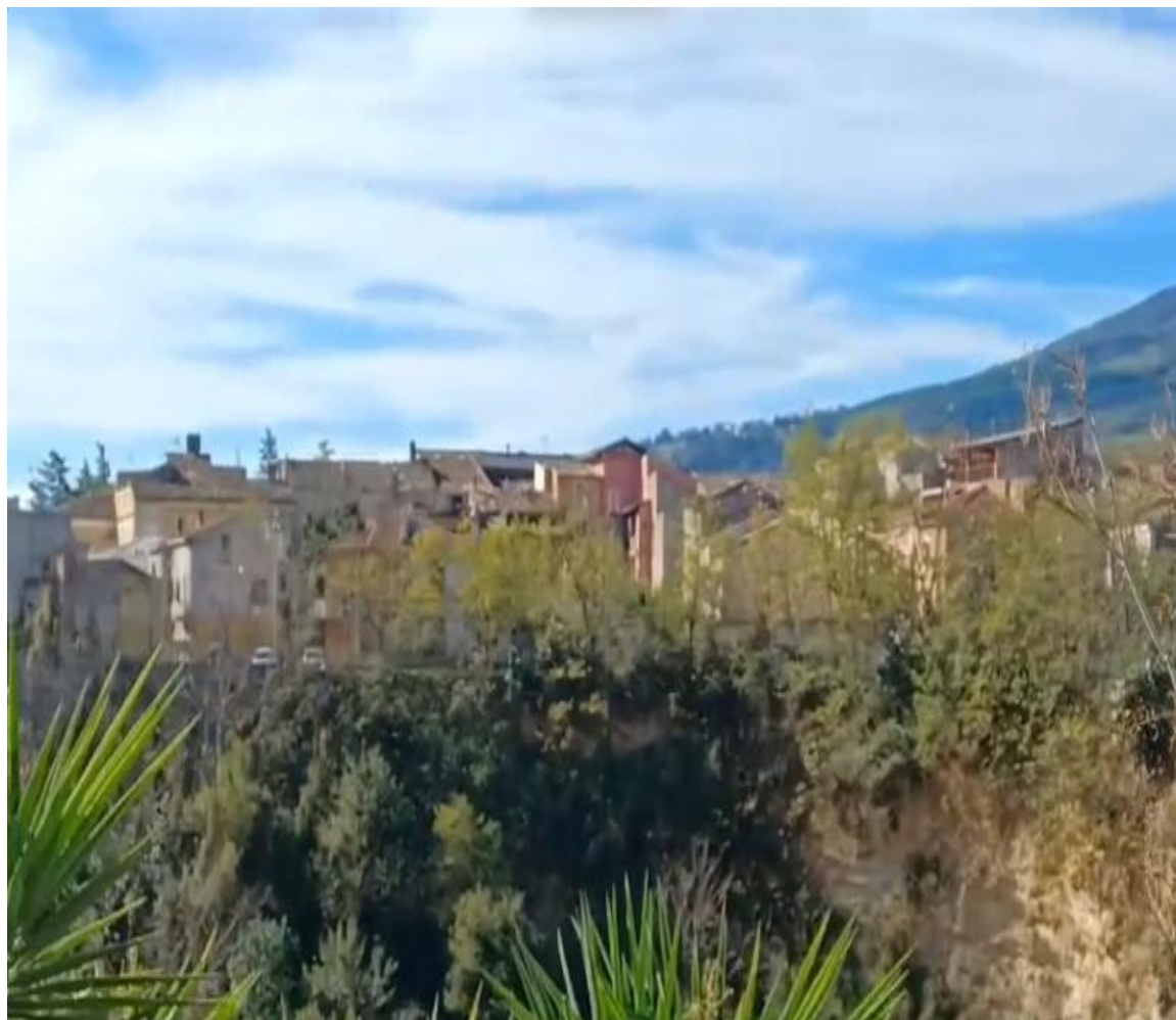
Figure 3 PUNTO CRITICO 1 AL 19.07.2023

INDIFFERIBILE MESSA IN CAMPO DI MISURE DI MITIGAZIONE DEL RISCHIO DI DISSESTO DEL VERSANTE DEL CANAL GRECO CHE INTERESSA LA VIA MAZZINI NELL'ABITATO DI CASTROVILLARI, PER CHIARA EVOLUZIONE IN ATTO DEL QUADRO DI DISSESTO IDROGEOLOGICO COSTITUENTE POTENZIALE PERICOLO PER LA INCOLUMITA' PUBBLICA.