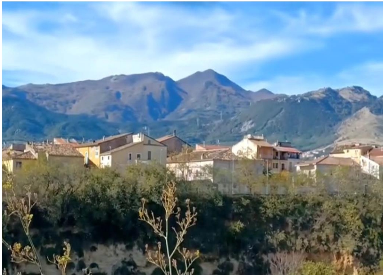
Figure 6 PUNTO CRITICO 2 AL 19.07.2023

INDIFFERIBILE MESSA IN CAMPO DI MISURE DI MITIGAZIONE DEL RISCHIO DI DISSESTO DEL VERSANTE DEL CANAL GRECO CHE INTERESSA LA VIA MAZZINI NELL'ABITATO DI CASTROVILLARI, PER CHIARA EVOLUZIONE IN ATTO DEL QUADRO DI DISSESTO IDROGEOLOGICO COSTITUENTE POTENZIALE PERICOLO PER LA INCOLUMITA' PUBBLICA.