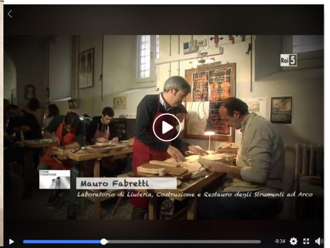
Rai Italia - Terza Serie Puntata 9 - 31 luglio Campus Italia Il Corso di Liuteria del Conservatorio di Musica S. Cecilia