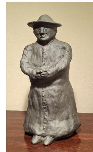
Scultura di Giorgio Pini