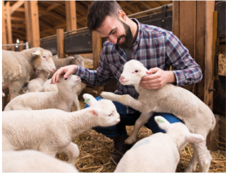
TAVOLA ROTONDA - FIERA DI SAN MARCO - I GIOVANI IN AGRICOLTURA E ALLEVAMENTO, TRA INNOVAZIONE E PROSPETTIVE

Incontro per dare voce al territorio e semplificare la burocrazia delle aziende agropastorali. Focus su strategie per una gestione più efficiente e sostenibile, accelerando l'accesso ai fondi di sviluppo, favorendo dialogo e crescita economica regionale connessa all'Europa.