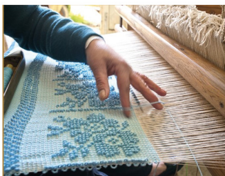
TAVOLA ROTONDA - FIERA DI SAN MARCO - GIOVANI E ARTIGIANATO RURALE, FORMAZIONE, IDENTITÀ, FUTURO

Un dialogo aperto tra artigiani, produttori di manufatti artistici, istituzioni e commercianti per analizzare sfide e opportunità. Condividere prospettive su come la certificazione dei prodotti possa tutelare tradizioni, garantire qualità e promuovere l'unicità dell'artigianato di pregio sardo.