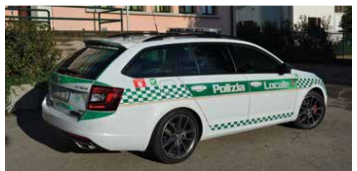
Dall'alto: la Polizia locale sul colle Sant'Ambrogio, in via Cavour e in Municipio