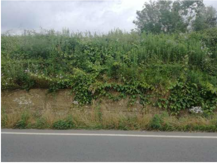
PORTAMENTO VITE INSELVATICHITA SU MURO

Partenza: AOO A1700A, N. Prot. 00008135 del 16/04/2026