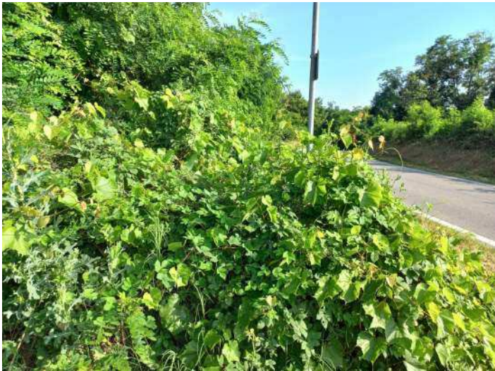
PORTAMENTO CESPUGLIOSO DI VITE INSELVATICHITA, A RIDOSSO STRADA, CHE TENDE A INVADERE SEGNALETICA STRADALE