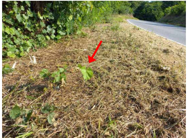
RICACCI DI VITE INSELVATICHITA