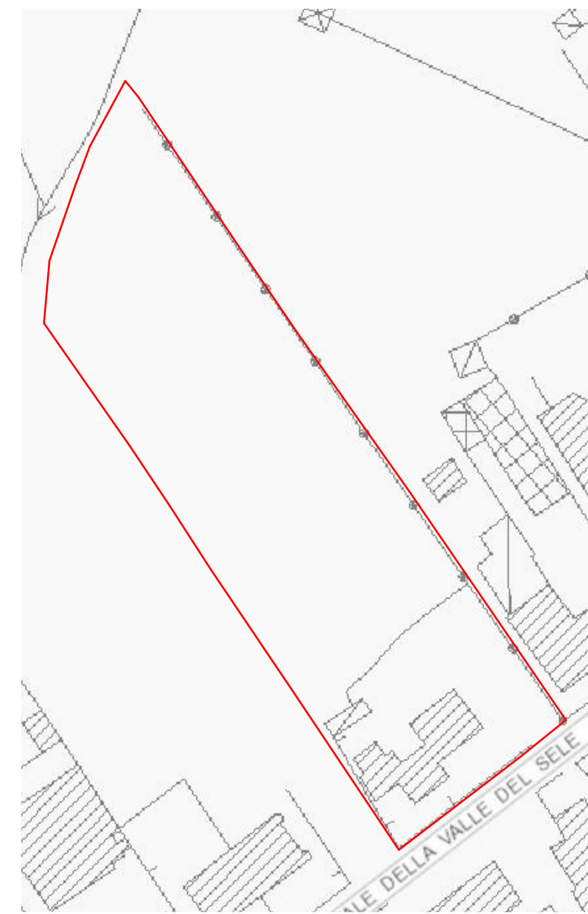
Planimetrica generale stato di fatto / Aereofotogrammetria (1: 1.000)