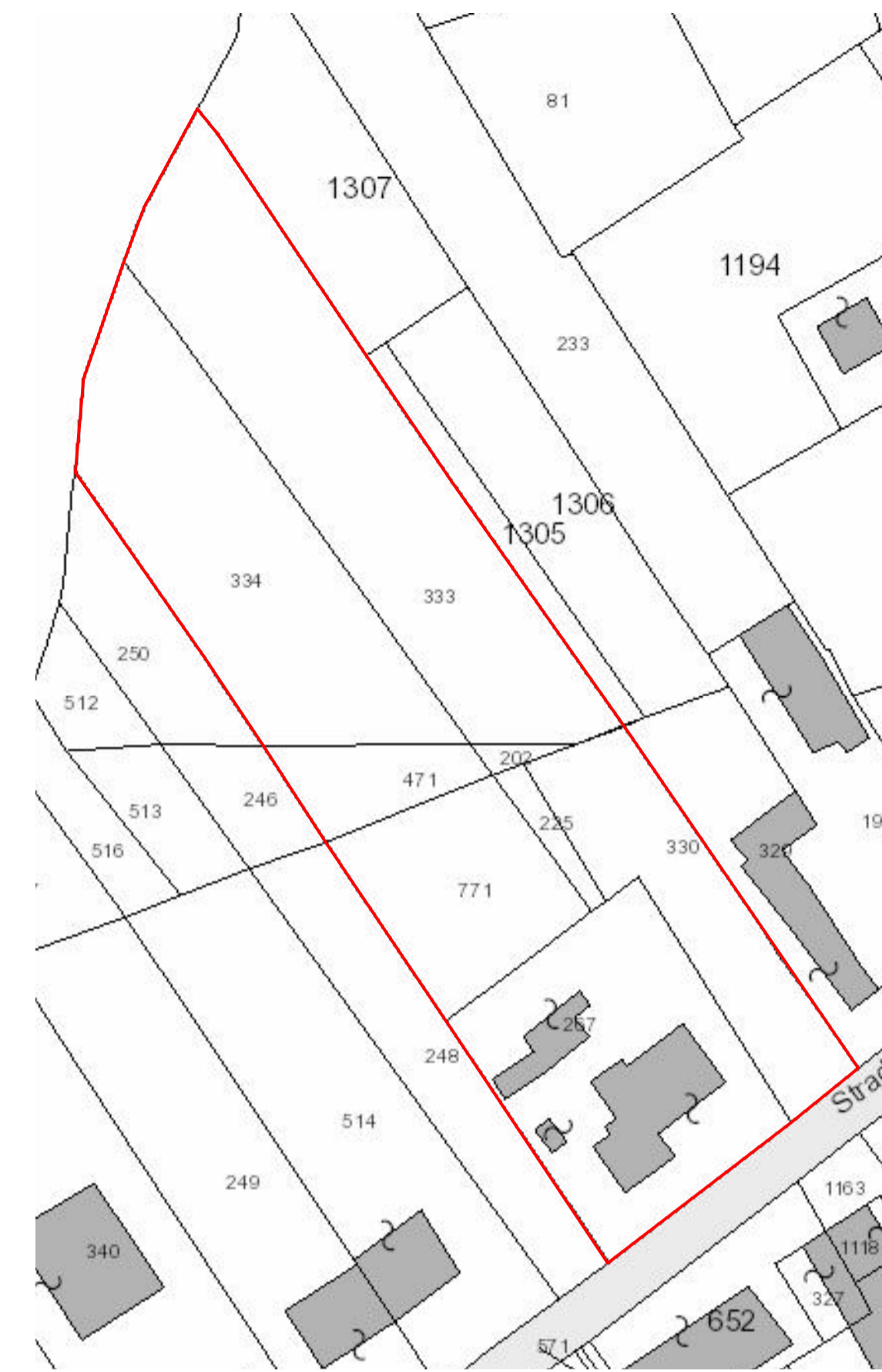
Planimetrica generale stato di fatto / Catastale (1: 1.000)