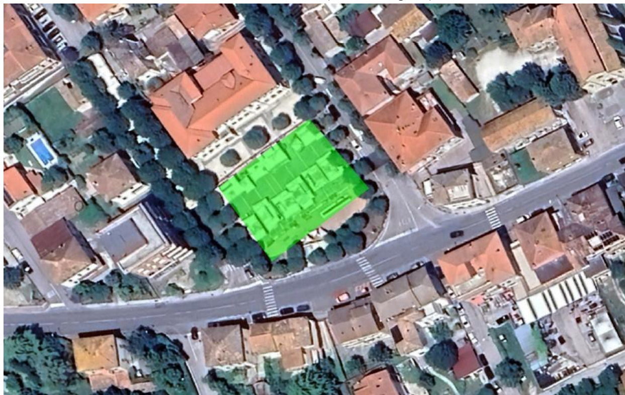
CARTOGRAFIA AREA (stralcio/fotografia)