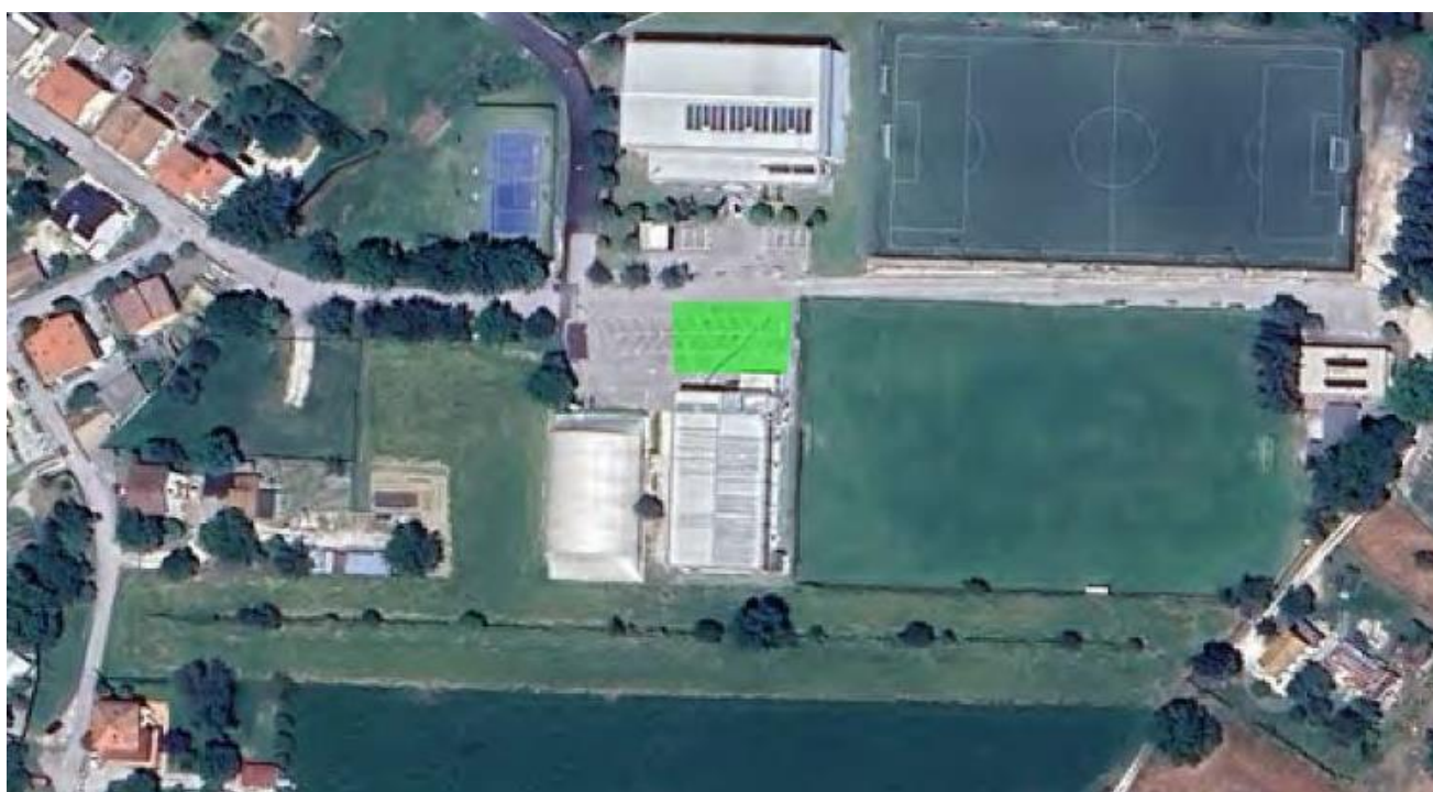
CARTOGRAFIA AREA (stralcio/fotografia)