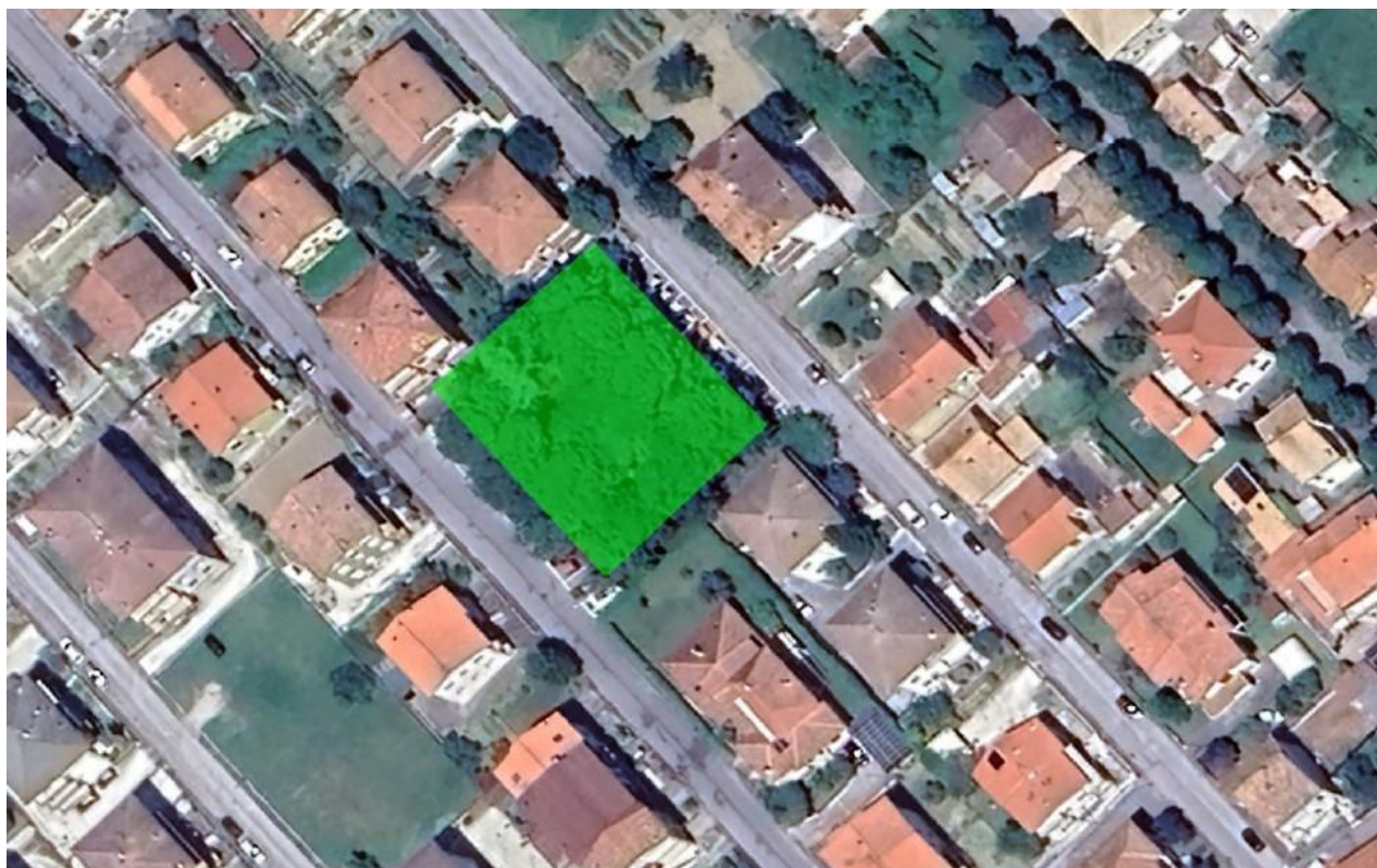
CARTOGRAFIA AREA (stralcio/fotografia)