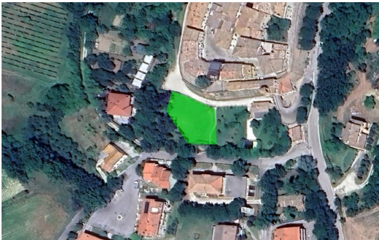
CARTOGRAFIA AREA (stralcio/fotografia)