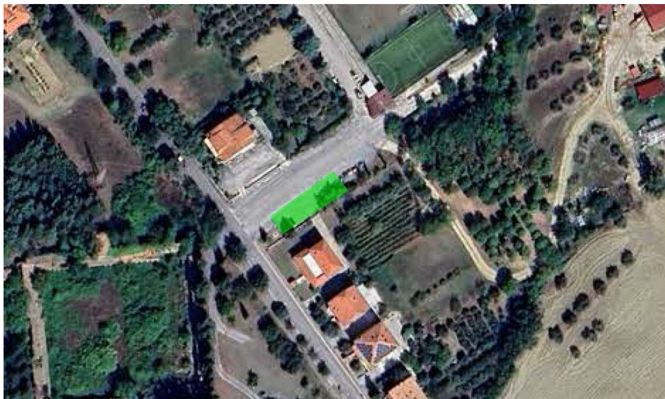
CARTOGRAFIA AREA (stralcio/fotografia)