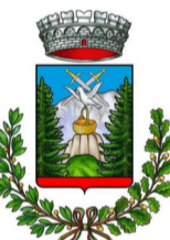
Comune di Cornalba