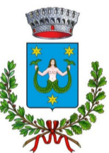
Comune di Serina