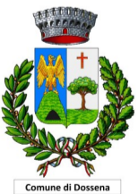
Comune di Dossena