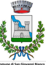
Comune di San Giovanni Bianco