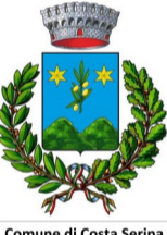
Comune di Costa Serina