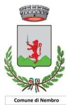
Comune di Nembro