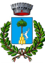
Comune di Aviatico