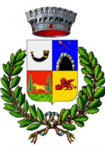
Comune di Camerata Cornello