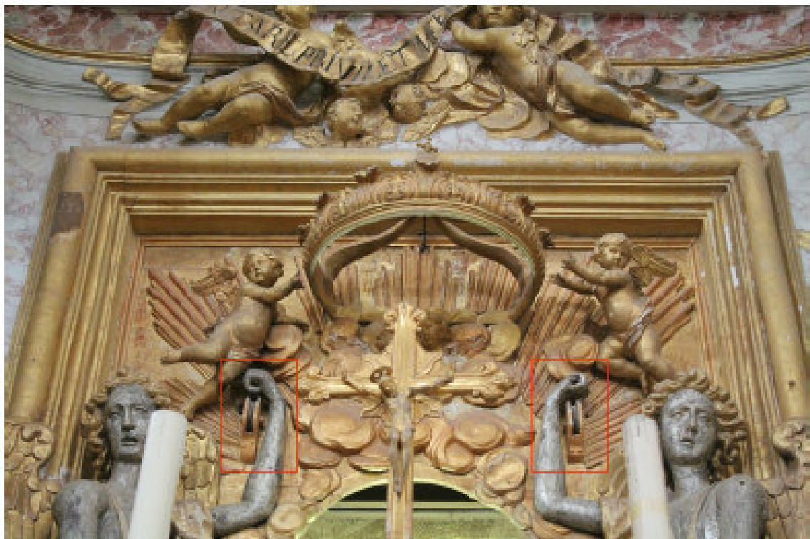
Fig. 27 - Dettaglio delle due carnocle che raccoglievano le corde in uscita dal castiglio, passanti attraverso le mani dei due angeli