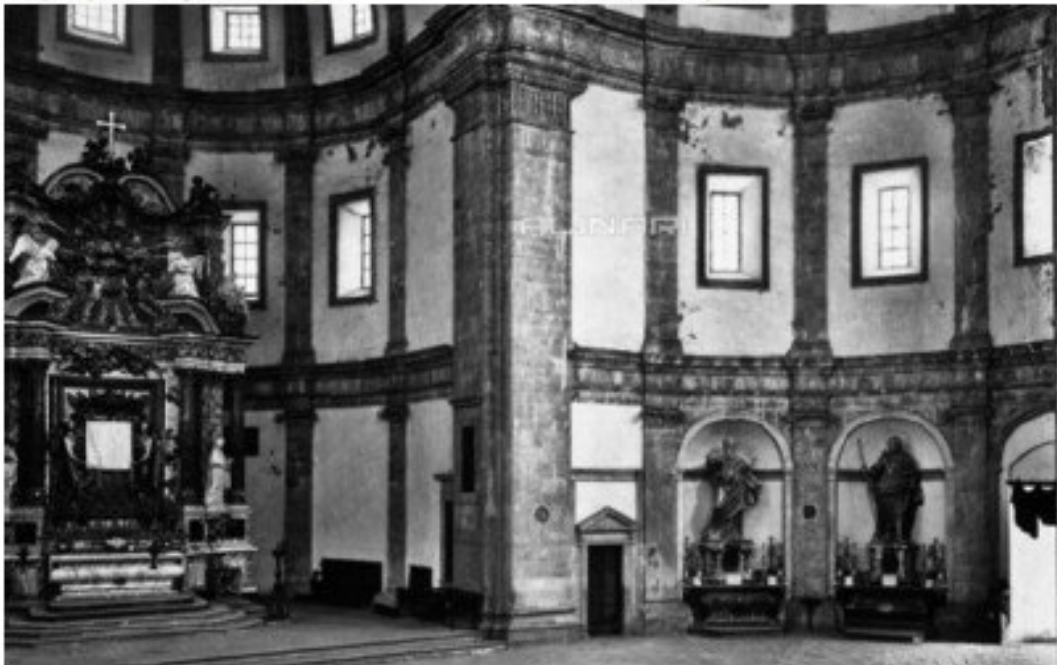
Fig. 26 - Dettaglio di foto senza data, in cui è ritratta la cortina