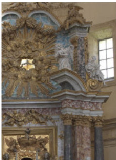
Fig. 36 - Il raccordo curvo lievemente percettibile dalla vista frontale