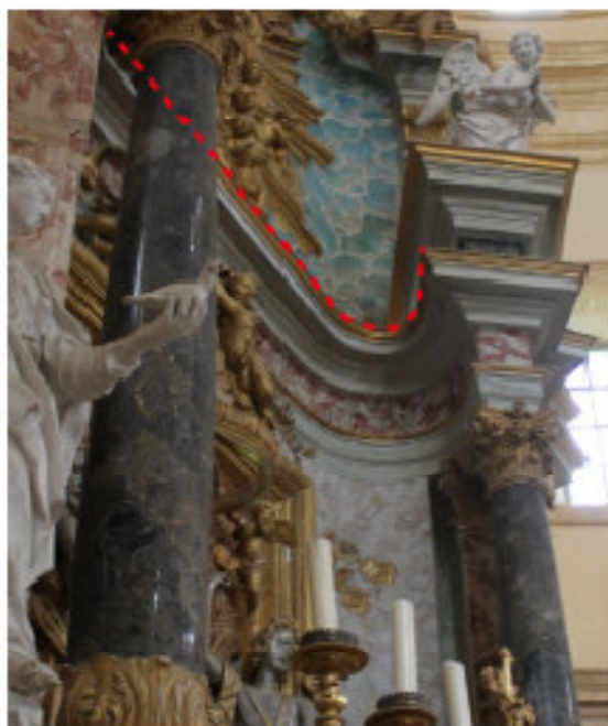
Fig. 35 - Raccordo curvo parete-colonna