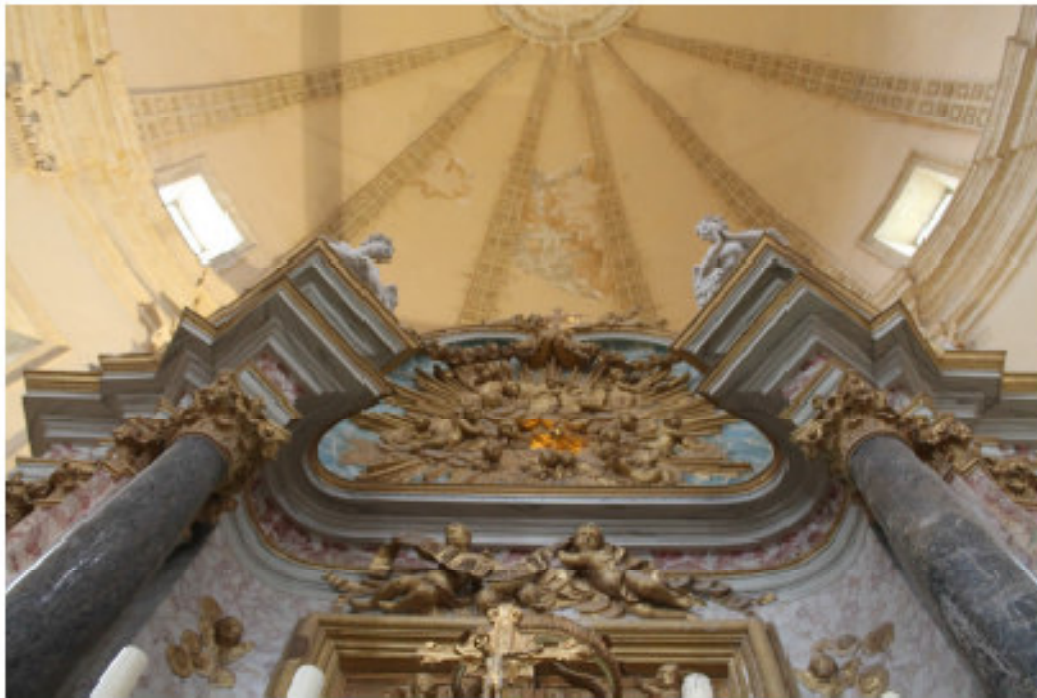
Fig. 16 - Vista dal basso che evidenzia l'andamento concavo della parete e trabeazione sovrastante