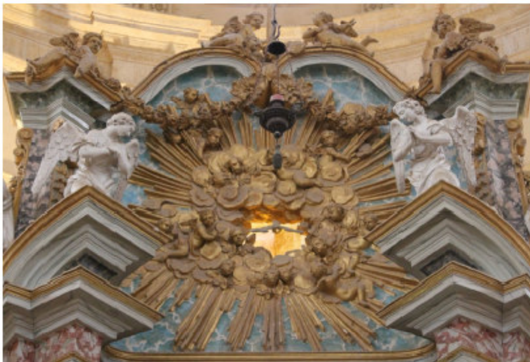
Fig. 17 - Particolare dell'attico, al centro del timpano spezzato la colomba raffigurante lo Spirito Santo