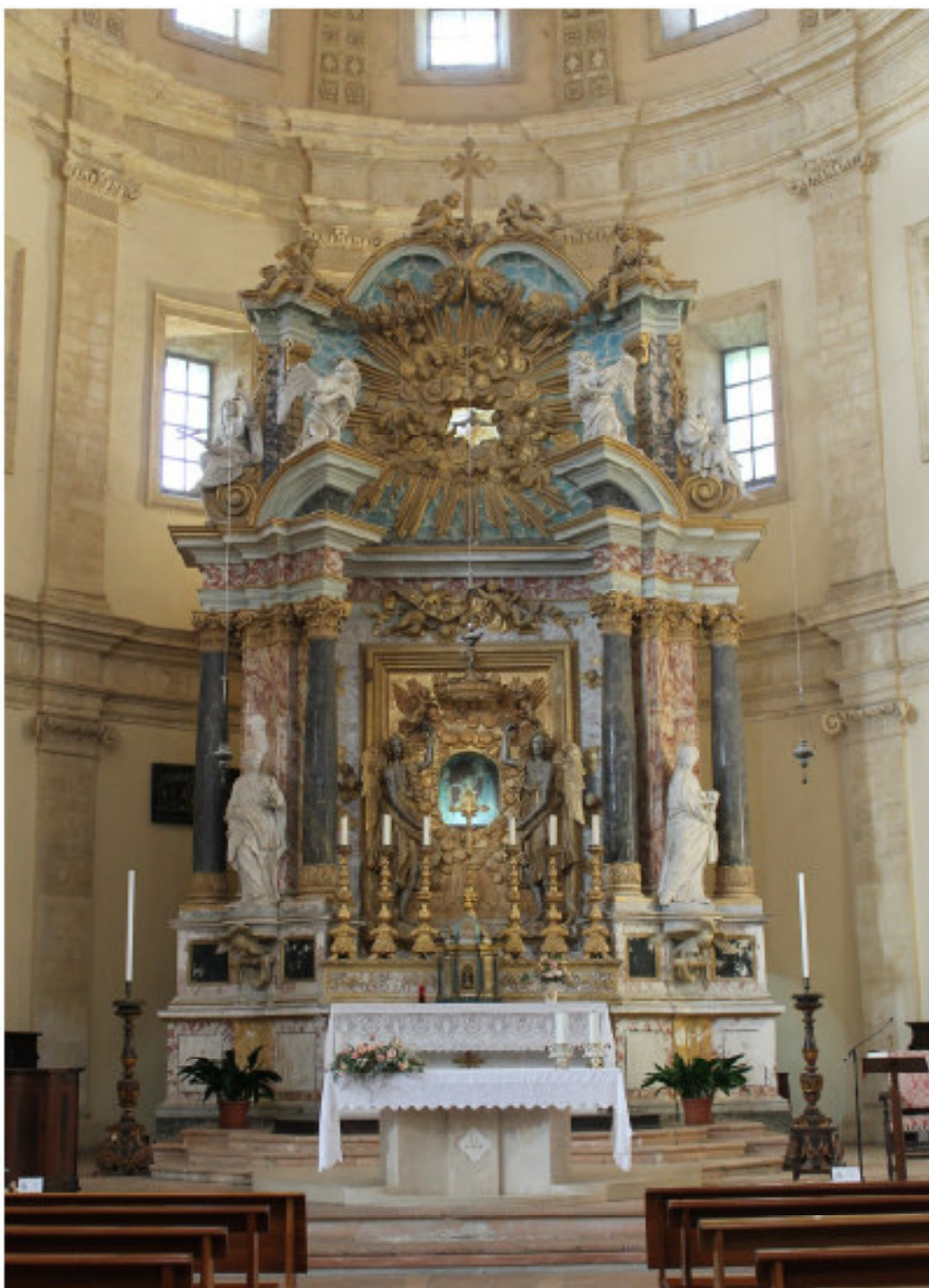
Fig. 11 - S. Maria della Consolazione Vista frontale dell'altare maggiore

Vergine era accompagnata dalla luce delle candele, dal suono dell'organo e dei violini, dalle orazioni ed infine dal tuono degli spari di archibugio e dei fuochi artificiali. Tali manifestazioni avvengono ancora oggi, senza però la messa in azione del meccanismo, il quale risulta ormai in disuso; l'immagine resta così perennemente scoperta.