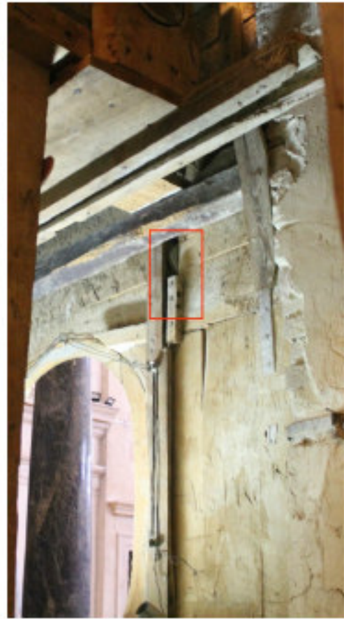
Fig. 25 - Dettaglio di una delle due carrucole inserite nel cartoccio ligneo