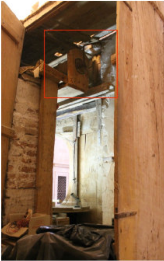
Fig. 24 - Intercapedine tra il cartoccio e l'immagine. Da notare l'argano posto sulla parte alta del vano