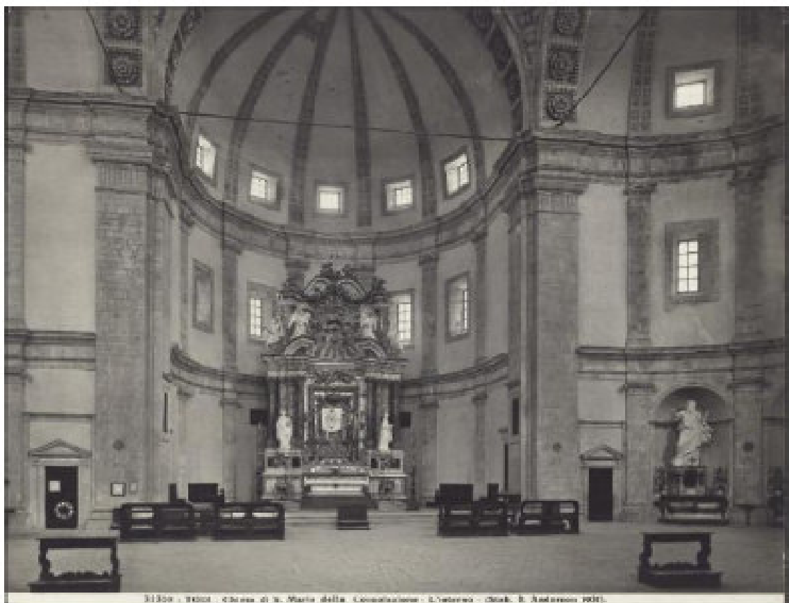
31309 - 31308 - Chiesa di S. Maria della Consolazione - L'Aterno -.