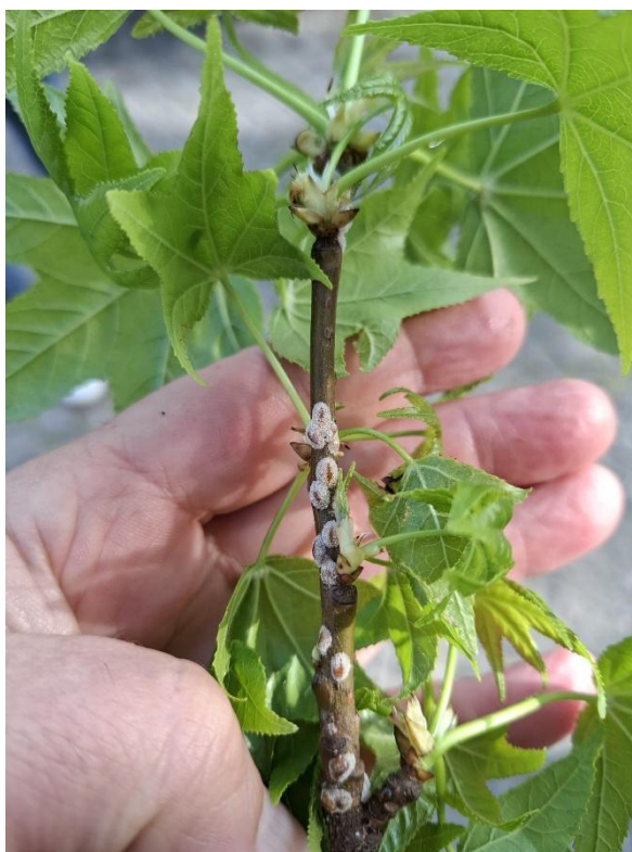
Fig. 2 – aprile 2026 in crescita, con produzione melata