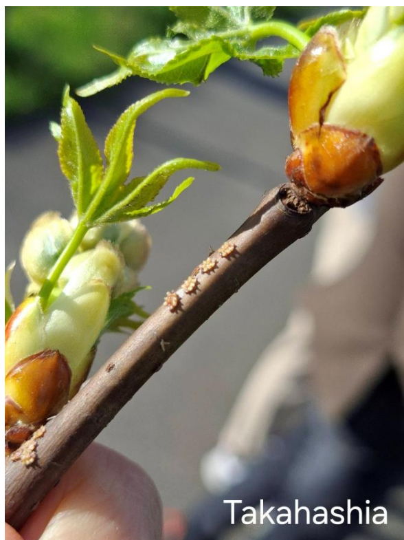
Fig. 1 – forme svernanti a marzo 2026