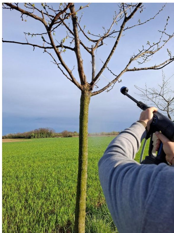
Fig. 3 – lavaggio meccanico con acqua a pressione marzo 2026