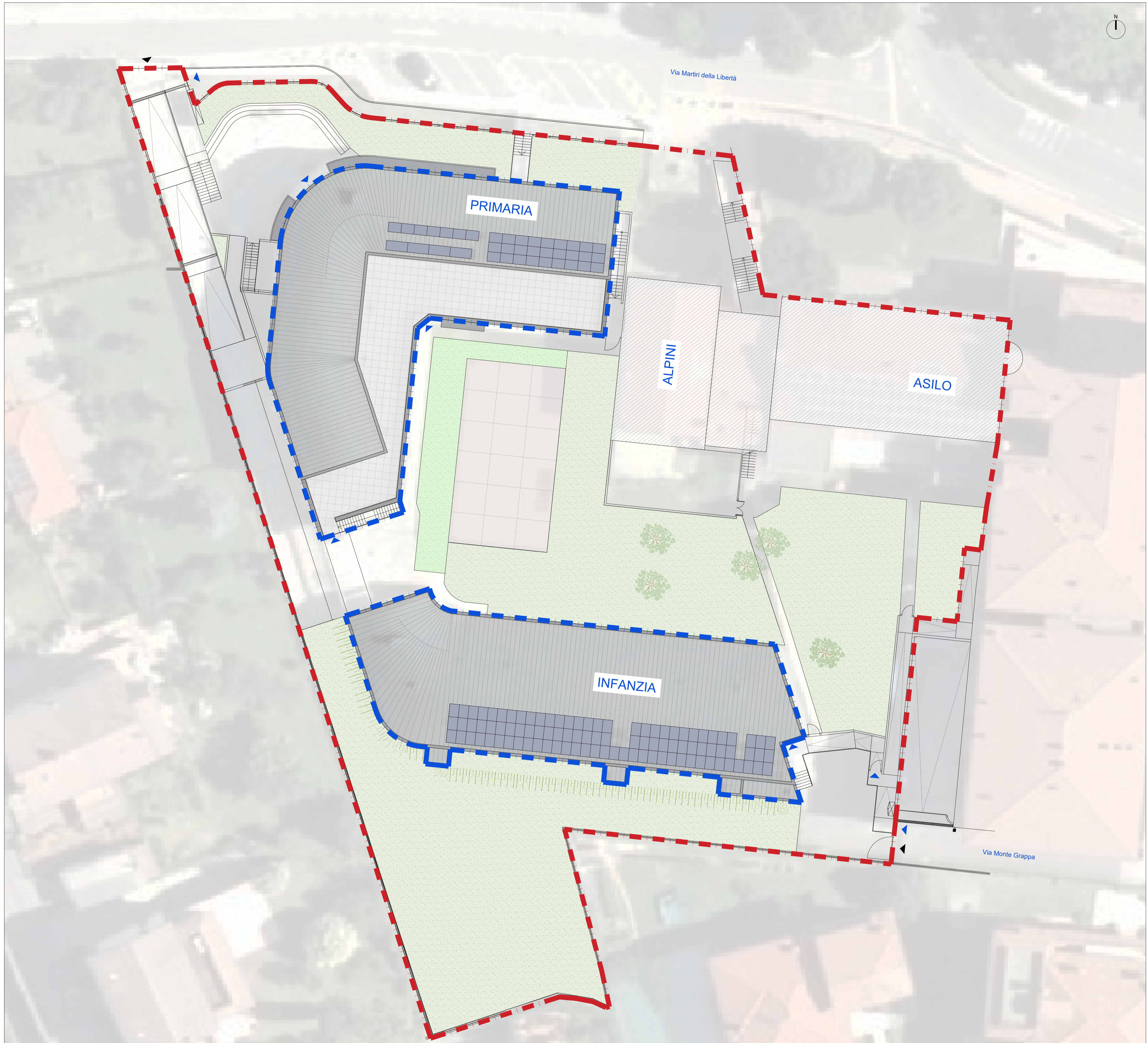
Planimetria generale scala 1:200