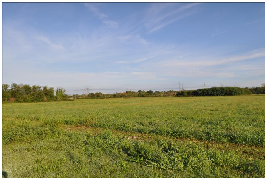
Figura 3. Area di intervento.

Di seguito si riportano alcune immagini fotografiche dell'intervento.