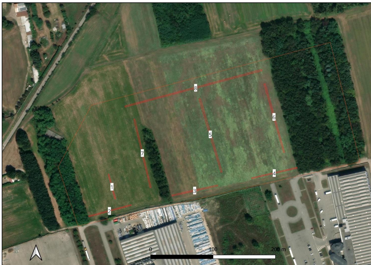
Figura 2. Planimetria delle trincee eseguite.

Sono state eseguite 8 trincee con mezzo meccanico dotato di benna liscia. La larghezza delle trincee è stata di circa 1,6 metri, la profondità variabile sulla base del substrato naturale da 40 a 100 cm. con approfondimenti fino a 180 cm. Lo sviluppo complessivo delle trincee è stato di circa 1800 metri lineari.