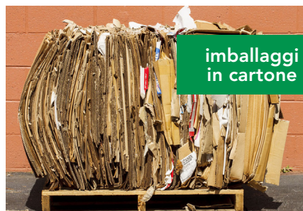
imballaggi in cartone