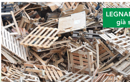
LEGNAME e mobili già smontati