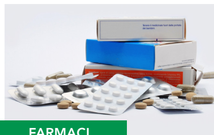
FARMACI e siringhe