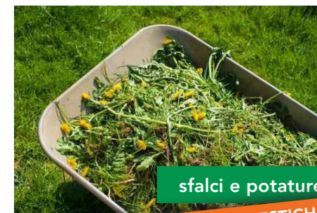
sfalci e potature