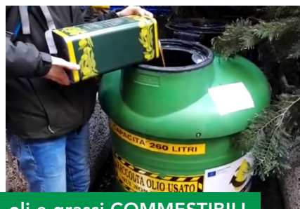
oli e grassi COMMESTIBILI oli MINERALI esausti