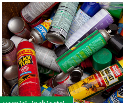
vernici, inchiostri, adesivi e resine