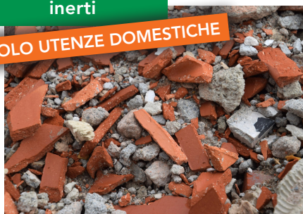
inerti - sabbia gatto senza feci