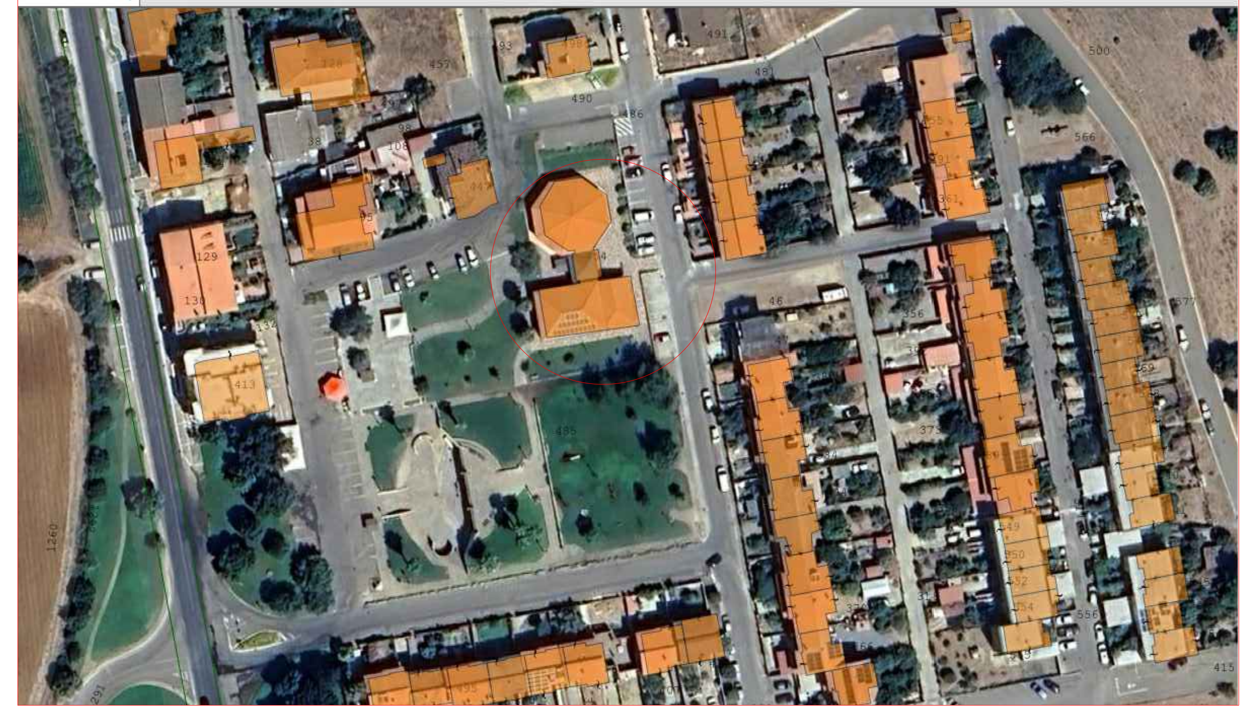
STRALCIO INQUADRAMENTO CATASTALE