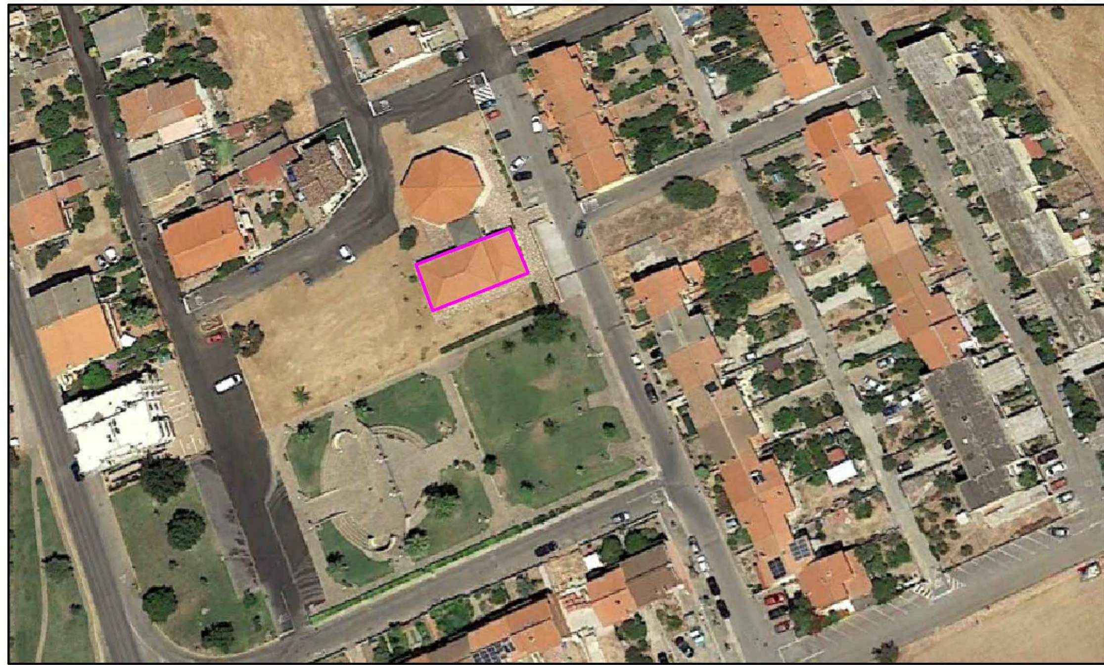
STRALCIO INQUADRAMENTO TERRITORIALE