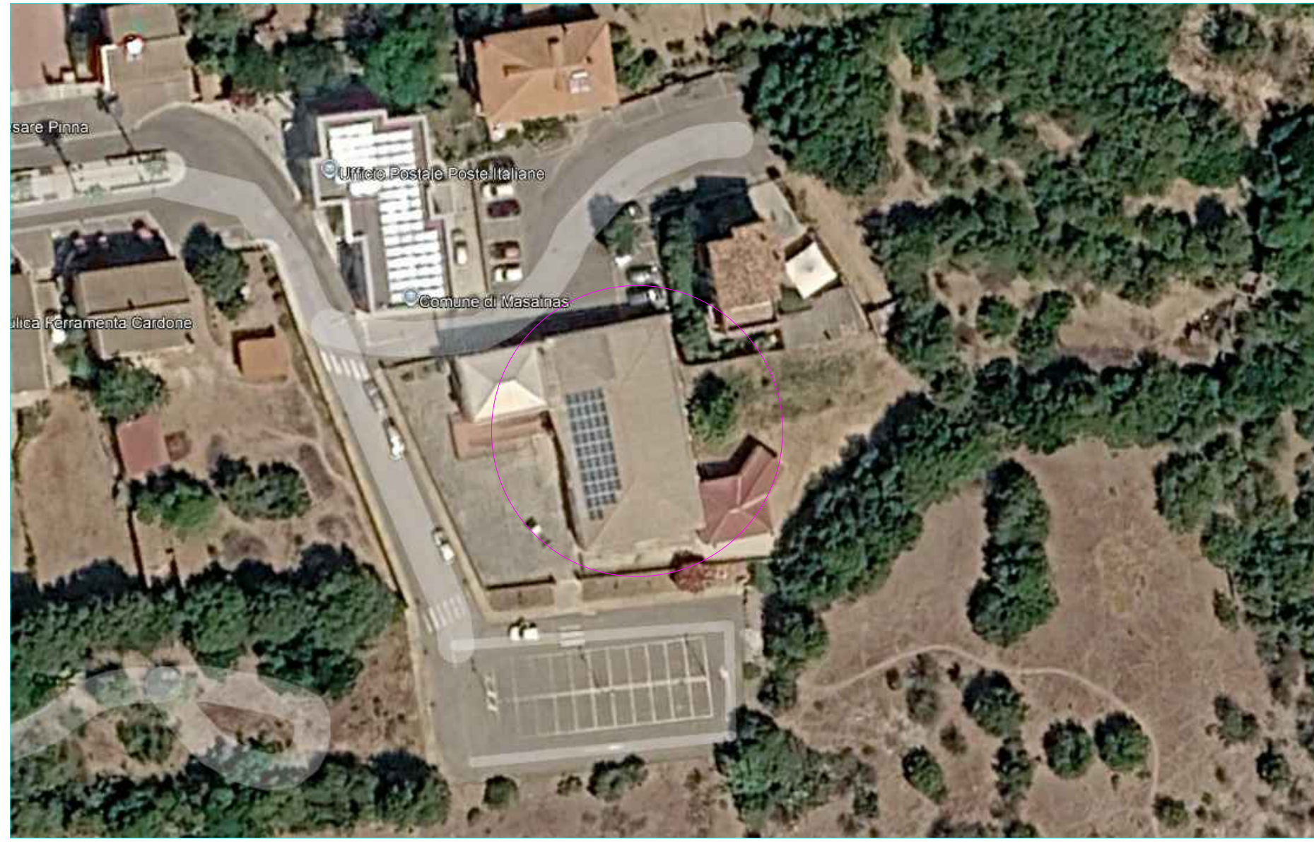
STRALCIO INQUADRAMENTO TERRITORIALE